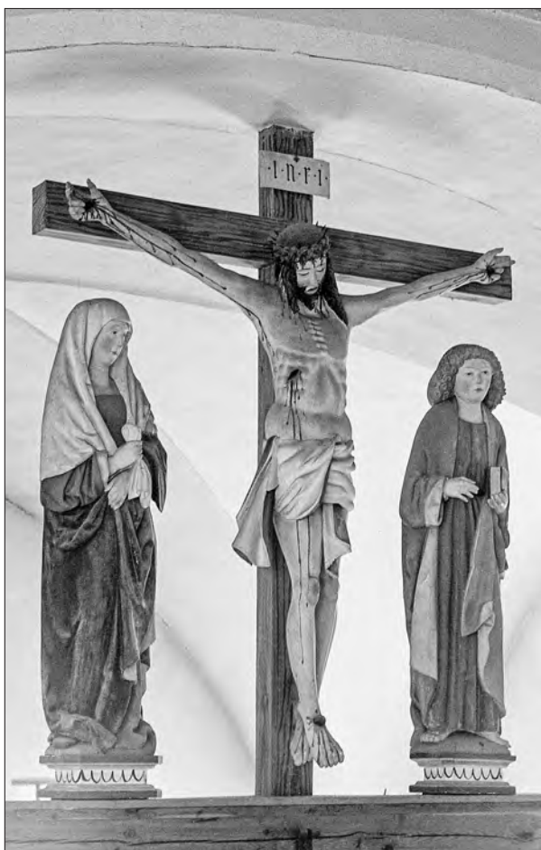
Skupina křižowanja w Njeswačanskej cyrkwi

Jana a Jakuba dla jeju žadanja. Nawopak: Wón jimaj rozkladže, što to rěka, při nim stać abo pódla njeho sedžeć: