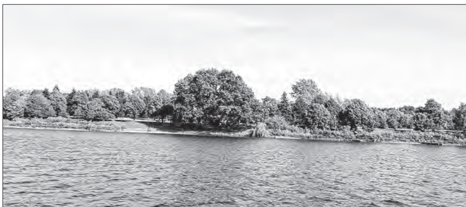
Wulke štomu při čerstwej wodže