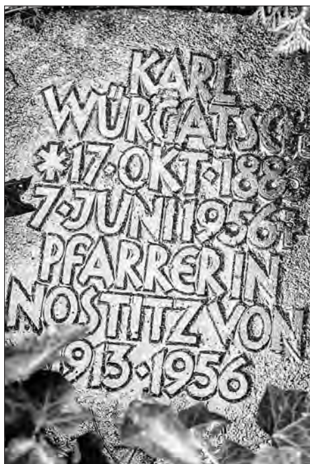
Napis na rowje fararja Korle Wyrgača při cyrkwi w Nosaćicach pola Wósporka