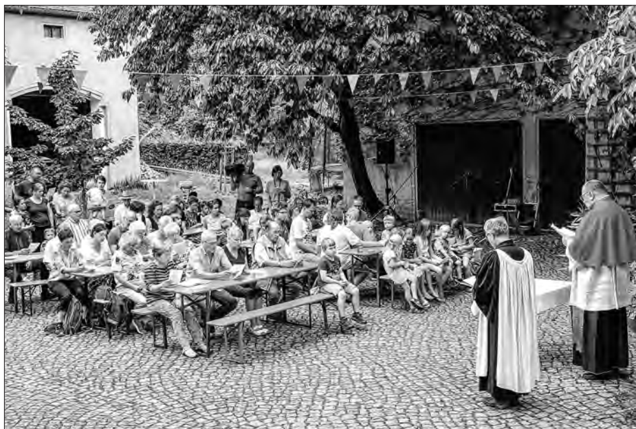
Ekumeniska nutrnosć na dworje Maćijec/Jaworkec statoka