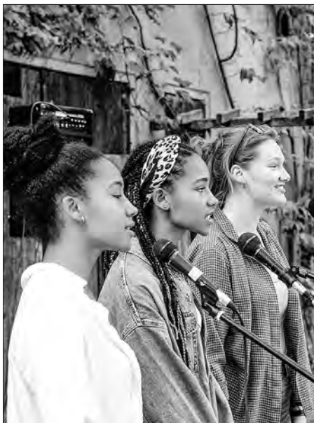
Skupina Trojozjnk zawjeseli připoslušarjow ze serbskimi a mjezynarodnymi spěwami.