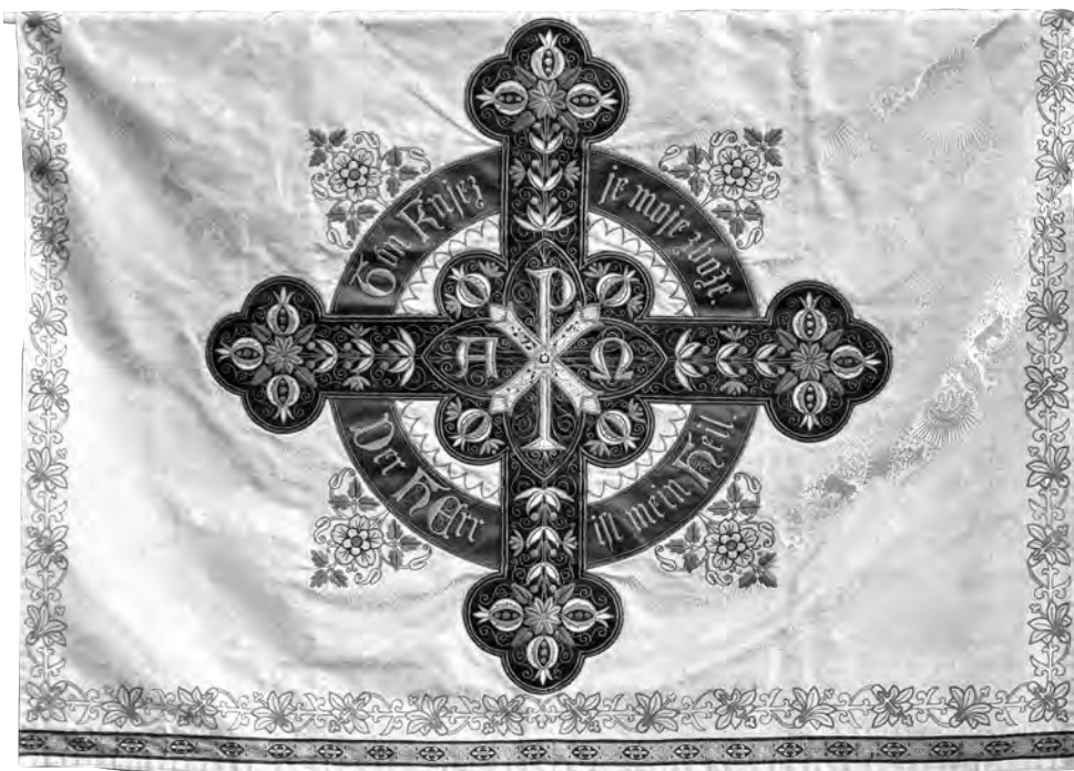
Běly wołtarny parament w Hodžijskej cyrkwi ma napis „Tón Knjez je moje zbože.“