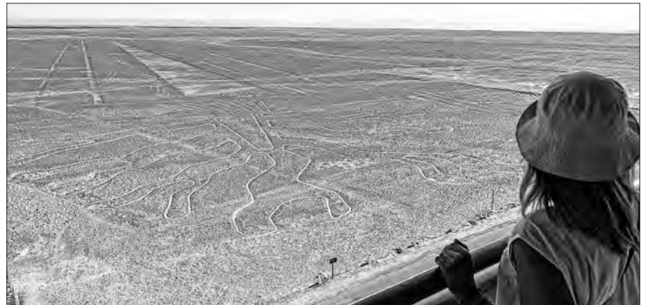
Z Nasca-linijow molowana figura w puscínje na juhu Peruwa