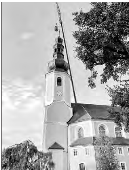
Wjeršk Bukečanskeje cyrkwineje wěže je zaso kompletny.

Čakanje do pjatka rano so wudani. Slónco so z jasneho njebja swěčeše a po-wětr bě cichi, štož je žadne w hewak chě-