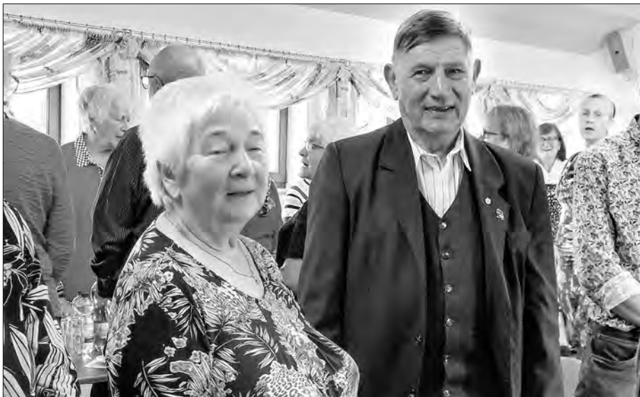
K wuznamjenjenju z čestnym znamješkom Domowiny zanjesechu zhromadźeni Dieterej Stoppelej trójnu „Sławu“, pódlu njeho jeho mandželska.