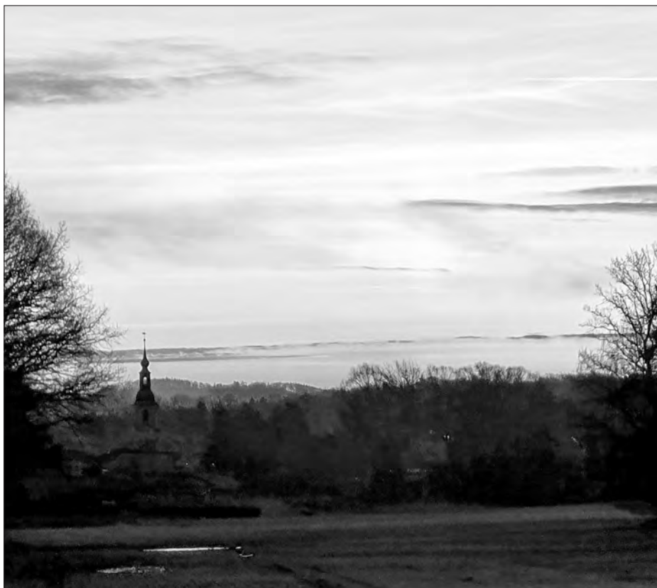
Rańše zerja nad Husku