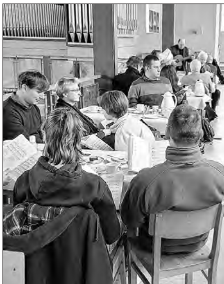
Spěwanje a kofejpiće po lońšich serbskich jutrownych kemšach w Picnju

STSRC njeje z čłonom Domowiny. Zwiski wšak wudžeržuje k wjele partneram, kaž