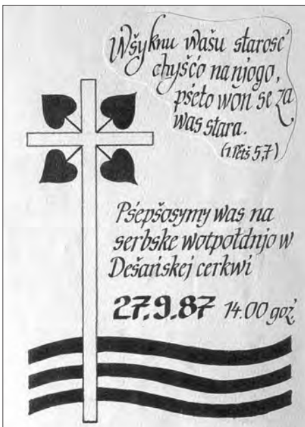
Přeprošenje na přenje delnjoserbske kemše nowšeho časa 1987 w Dešnje

wym Casniku z 2.7.1994 wšak so dosć pozdže wozjewi, mjenujcy w čisle z dalšimi cyrkwinskimi powěscemi. Pisa so tež wo tym, zo přewozmjje wot awgusta 1994 serbski předar Juro Frahnaw podawanje nabožiny na Delnjoserbskim gymnaziju, zo wotmě so 18./19. junija w Njeswačidle 48. serbski cyrkwinski džer a zo založi so tam Serbske ewangeliske towarstwo (dale SET), kotremuž hnydom 40 wosobow přistupi. Tež člonoj předsydstwa SET so mjenuja. Bohužel so mjena člonow přenjeho předsydstwa STSRC njemjenuja. Můžeme jenož spekulować, čehodla: Bě cyrkwiske žiwjenje w ewangeliskej Hornjej Łužicy delnjoserbskim redaktorom bóle samozrozumliwe hač nowe serbske cyrkwiske aktiwity w Delnjej Łužicy?