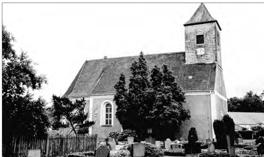
Cyrkej w Hućinje w lěće 1999