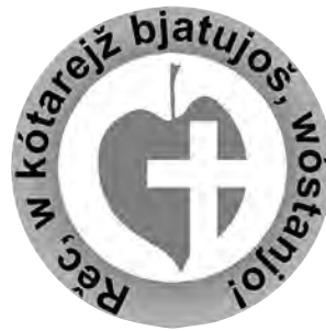
Button z logom Spěchowanskeho towarstwa za serbsku rěč w cyrkwi