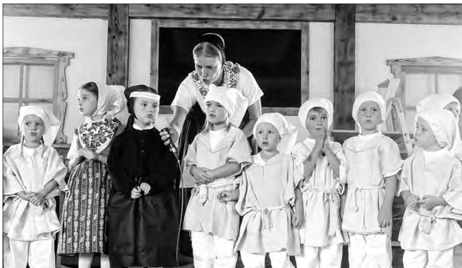
Dźěći pěstowarnje „Krabat“ předstajichu program.