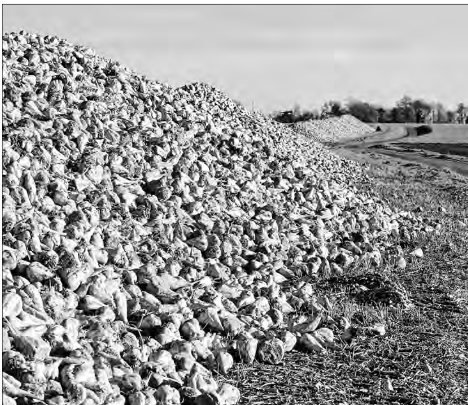
Bohate běchu žně.