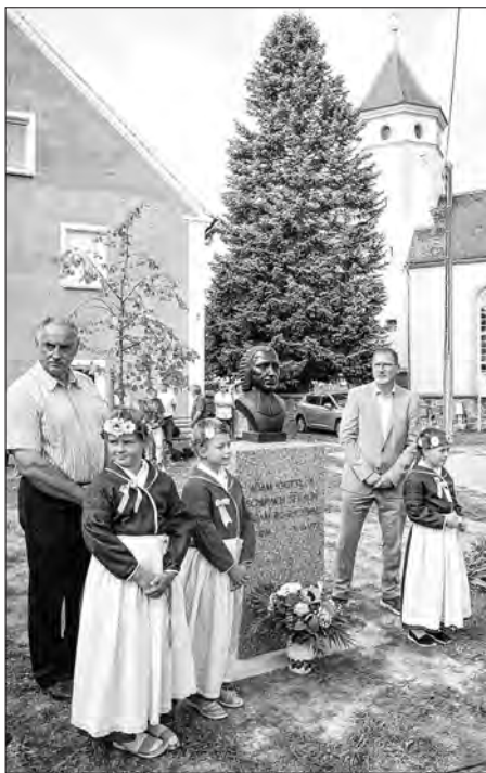
Po wotkryću pomnika Šeracha w Budyšinku