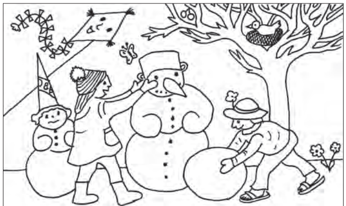
Na wobrazu je so wosom wĕcow schowaŭo, kiŭ so do zymskeho wobraza njehodŭa. Namakaĕe je? Rys.: Katja Meyerowa

Tuŭ je to jara rjane přeĆe, hdyŭ steŭi w kartce k narodninam: „Přeju Ći Bože žohnowanje.“ Waša Katja Meyerowa