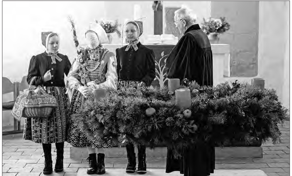
Wužohnowanje džěćetka na kemšach w Slepjanskej cyrkwi