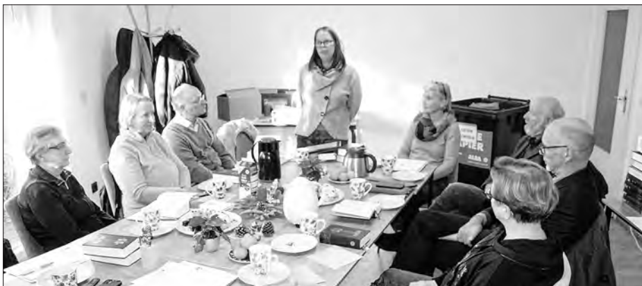
Zhromadźizna Spěchowanskeho towarstwa za serbsku rěč w cyrkwi w serbskim wosadnym srjedźišću w Choćebuzu-Chmjelowje