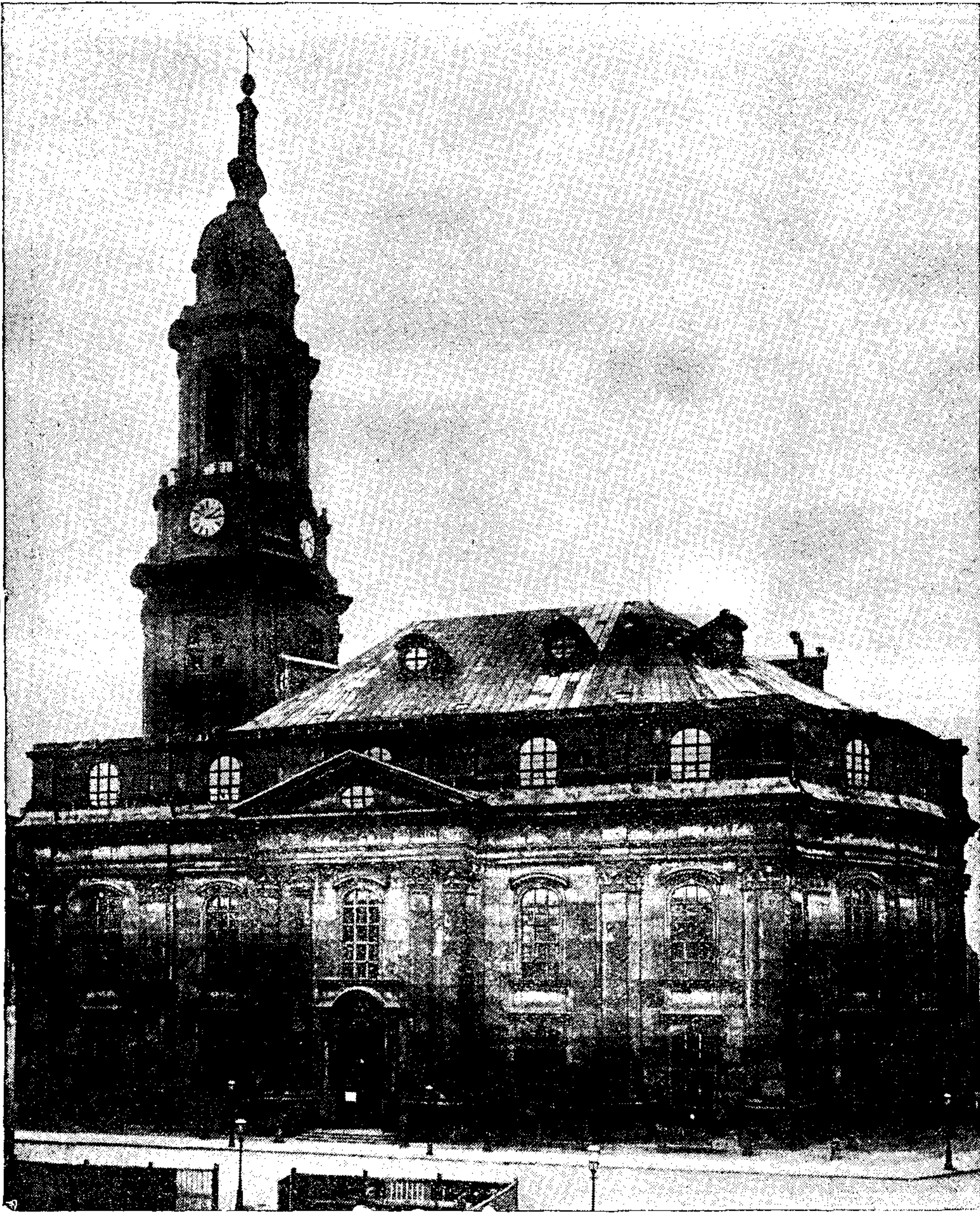
Sichizna zyrkej w Draždžanach do wotpalenja po šwonownym napohladže.

šak huadnje wodžil, so móže našch lud na 50 lětnym dnju šwojeje Wacžizy šakladny kamješ Wacžičneho domu položič, so nětko nadžija a prošza wjele lět šwojemu wěštemu dopjelniženju našchewčimo džetejš. Se šapiska nowišchich darow sa našch dom je s radošću pošnacž, so je tole wjekele tež šwój wothłóš namakalo w šerbstich wutrobach; pschetož jubilejške darj so žórlič šapocžnu, ale to je jich tola hišćeže jara malo, kofšiz šu so na tule šwoju pschisšlušchnošć dopomniłi. Šak wjele lubnych Šerbow so hišćeže na našch jubilejš dopomnił njeje, runjež jim cžežto bylo njeby, rjany dar woprowacž. Nječ ta šchucžka, kotruž nam Nowina podawa, tež našchim lubym čžitarjam do wutroby rěči: