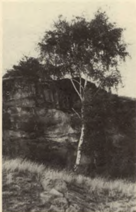
Pòj, wutroba, a wjesel so na darach Boha swojeho we lubym, lětnim času.