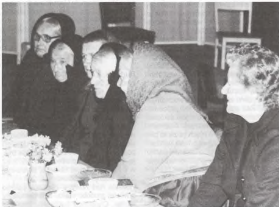
Wojerowčanki na serbskim wosadnym popołdnu

Budyšink. Nazymu zańdženého léta wobnowi firma Rentsch z Dobrošic naše pod pomnikoškitom stejace wrota na kěrchow. Pjenjezy za to pochadźachu ze statnych srědkow za škitane pomniki. Gmejna so za tute wobnowjenje poľnje zasadzi. Posledni króć wobnowichu so wrota w l. 1934. Zmjerzk a horcota stej wulkim džělam wudebjenjow jara škodźaloj. Po starych fotografijach a zawostatych zbytkach so tute wobnowjenje sta.