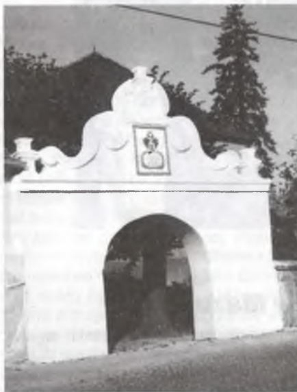
Wrota na kěrchow w Budyšinku