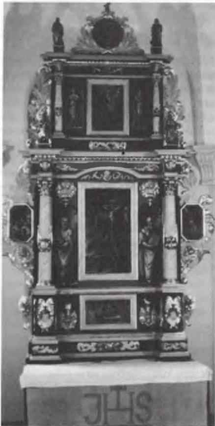
Woltar w Budestecach