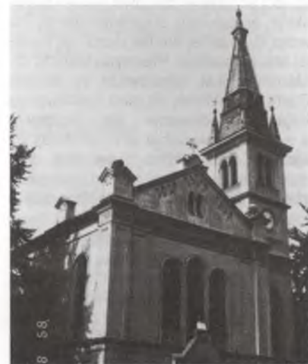
Ew. cyrkej w Ljubljanje

Lubljana ma katedralu a někotre wulke katolske cyrkwy. Tež impozantny prawoslawny Boži dom tam nadeńdžeš, ale žanu mošeju. N.