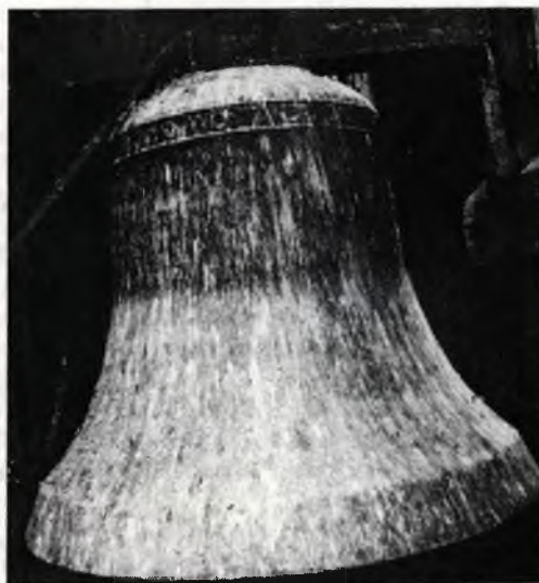
● Zwony wołaja tež 1993 kemši

Wšitkim čitarjam přeje za lěto 1993 strowosć, čitosć, wšo, štož je trěbne na čěle a na duši, wosebje pak Bože žohnowanje