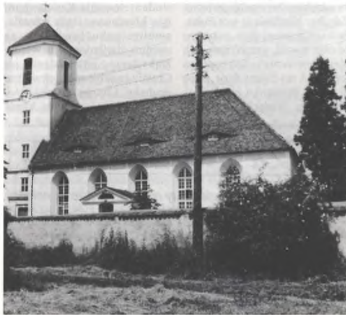
● Cyrkej w Barće