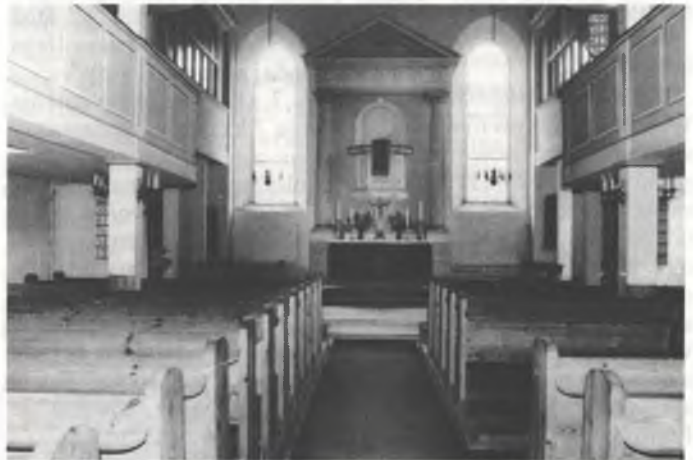
● Cyrkej w Barće

Za někotrych njewěrjacych je prašenje wažne, kak móžemy Boha spóznac. W džensnišim času, hdyž matej wědomosć a slědženje po zjawach našeho swěta a žiwjenje wulki wuznam a so čłowjeski rozum jako to najwyše wuchwaluje, wobhladuje so husto jenož to jako prawe, štož móže so z rozumom dopokazać. Tak nastanje potom z prašenja wo spóznacu Boha prašenje po dopokazu Boha. Na tajke prašenje dyrbi křescan