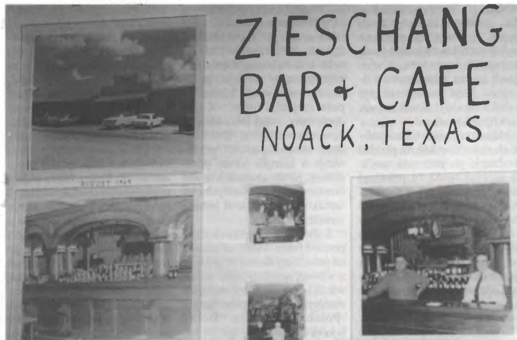
● Wšudže we wokolinje Serbina namakaš džensa potomnikow Serbow. Křižanec we wsy Noack wobhospodarja rjanu korčmu