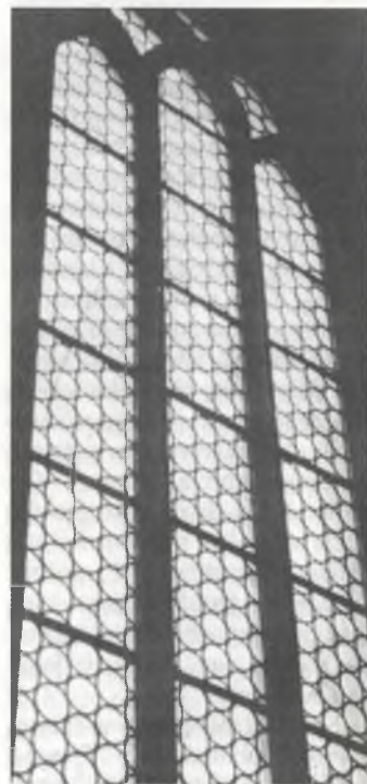
● Wokno w Michałskej cyrkwi w Budyšinje