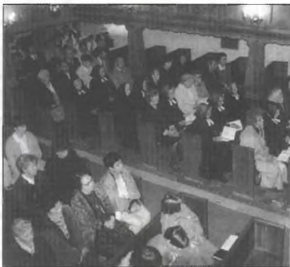
Něhdže 120 ludźi je so na kemšach w Slepom wobdźělilo