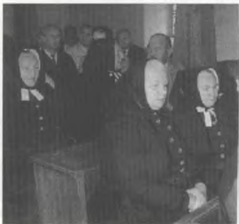
Slepjanki w kemšacej drasće

słowo husto we wobrotach kaž: "Ja wěrju, zo tute lěto zaso žanu porjadnu zymu njezmějmy" abo: "Ja wěrju, zo nalěčo bórže přindže." Hdyž spytamy to, štož je mēnjene, jónu z druhimi słowami wuprajić, potom móže-my to snano takle prajić: Ja sebi