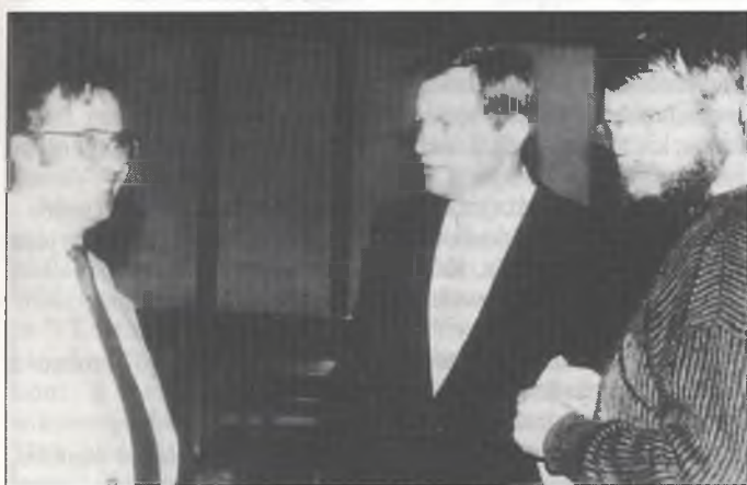
Bjesada na serbskim cyrkwinski dnju we Wojerecach

swojemu narodej najlěpješuzić. Dalše traće serbstwa pak leži w Božej ruce. M. Wirth