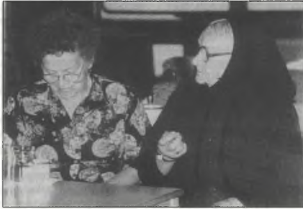
Na sobotnišim zarjadowanju cyrkwinskeho dnja