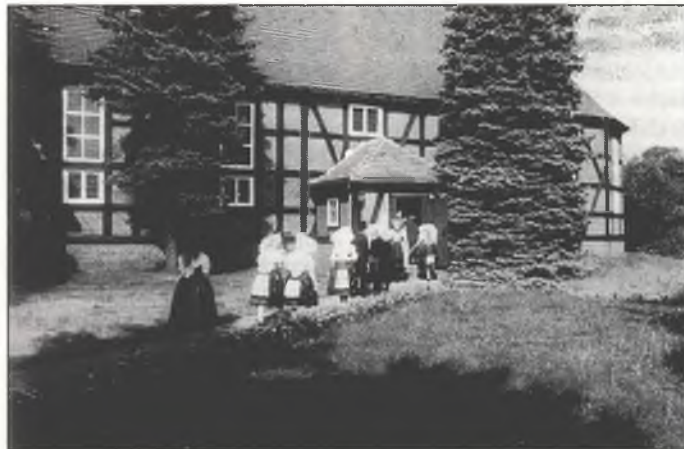
156 kemšerjow wobdžěli so na ds. kemšach 5.9.93 w Dešanskej cyrkwi. Na wopomnjenkej swjatočnosći bě potom někak 200 ludźi. Wuhladachmy tónkróć nic jenož mjez staršimi žonami nošerki serbskeje drasty, ale tež někotre młódshe žony su sej ju składnostnje swjedženja woblekli

Wětr drěma - z duše roni so myslička, pola, hona so pozhubja. Nócka płaščičk na zemju kryje, són džěcatstwa luboh mi dušu hrěje. P. Krječmar