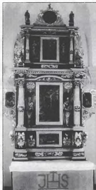
Wołtar Budestečanskeje cyrkwyje