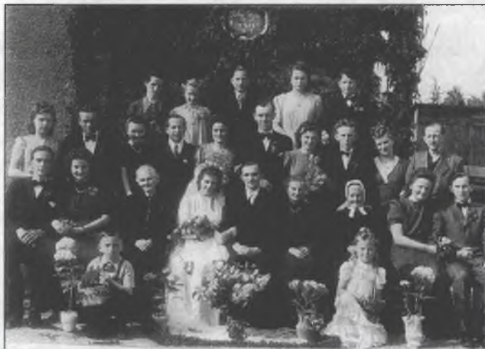
Kwas sotry awtora