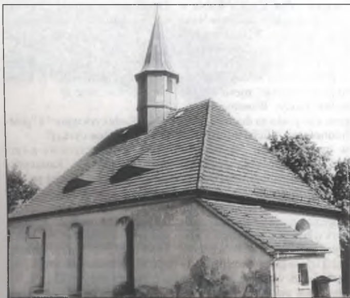
Cyrkej w Kotecach

Zaso je so jedyn z tych mužow minyl, kotřiž su naš serbski lud a našu serbsku rěč zahubjenju wutorhnyć pomhali. Štwórtk, 22. februara, popołdnju w 3/4 5 hodžin je wysokodostojny knjez Michał Hórnik, kanonikus kapitaris scholastikus swj. Pětra w Budyšinje, čicho wumrěť. Serbski lud z nim muža zhubi, kotryž so dla swojeje wučenosće a dla swojeho spisaćelskeho skutkowanja nic jenož w Serbach a Němcach, ale po cyłym słowjanskim swěće sławi a z čěscownosću mjenuje. Njebočički nje-lubowaše, ze swojeje wosobu před knježerstwom a při zjawnych naležnosćach za serbstwo wustupować. Jeho wašnje bě, sčicha z pjerom swoju maćernu serbsku rěč hajić a spěchować. W swojeje studowskej stwě wón sprócniwje wšědnje swoju