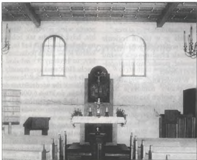
Cyrkej w Kotecach