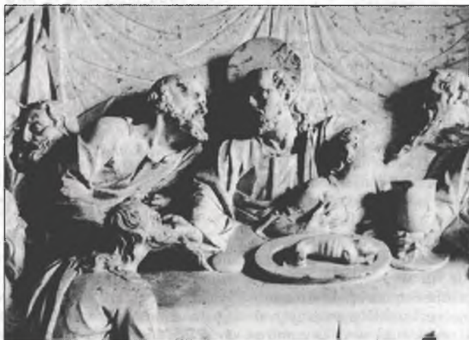
Bože wotkazanje Njeswaćidło