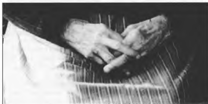
Pobožnej sprócnej ruce