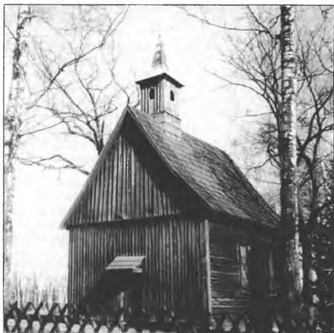
Drjewjana cyrkwička w Sprjowjach

Snano budže Wam – dyrbjeli Wy z „džiwami“ tak swoje pro- blemy měć – tež sada, zo do Boha wěrimy, jemu swoju do- wěru spožčamy, pomhać. My wěrimy do Boha, nic do dži- wów. ↩