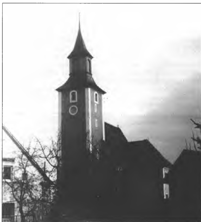
Cyrkej w Chołmje