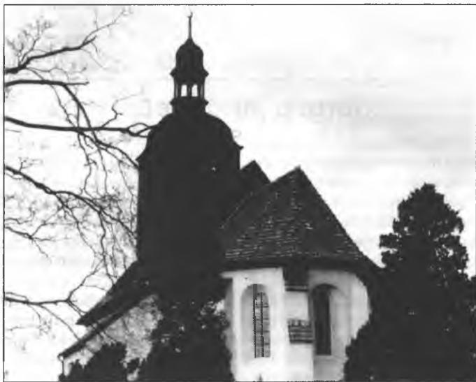
Cyrkej w Hbjelsku