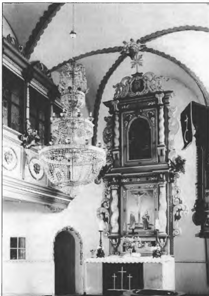
Cyrkej w Nosačicach