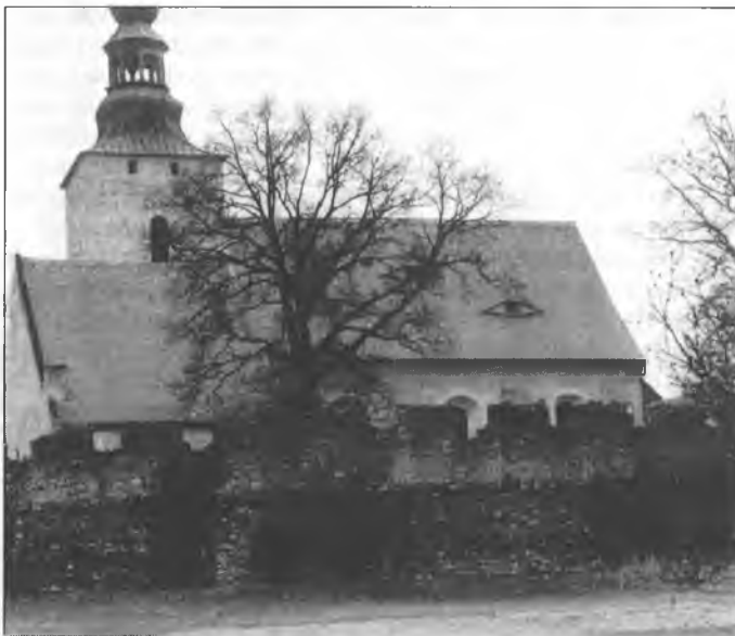
Cyrkej w Hórcce