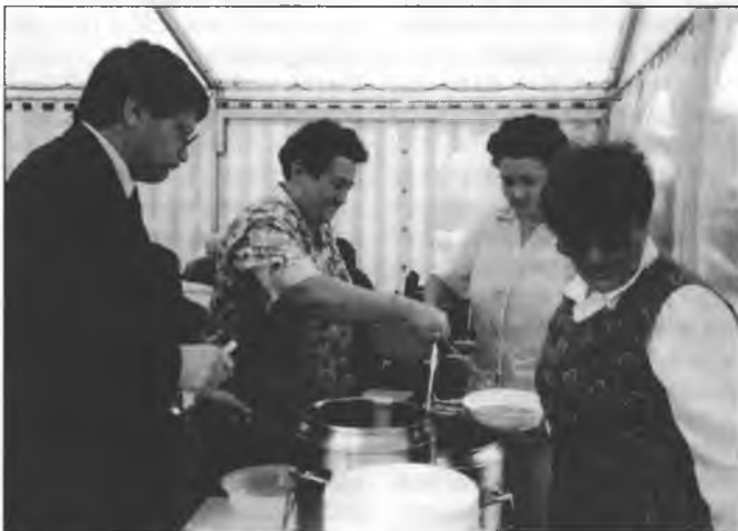
Klětnjanki na serbskim ewangelskim cyrkwiskim dnju wudawaja w stanje wobjed, kotryž bě nawarića policajska šula. Tykancy běchu Klětnjanki napjekli a kofej zwarili

Džětach tehdy hišće w ratariskim drustwje. W składze žita mějachmy wjetše mnóstwo měchow ze zornom napjelnic. W rózku ľubje běchu, wysokim wuhenjama twornje podobne, meterske roľ zornoweho dujadla nastajene. Stejachu tam cyle číše a njewinowace, jako njemóhli nikomu ani wloski skrěwdzić. Štó by w tym widzał něšto złe a samo strašne nawlečene pasle? Do jedneje roľ pohladawši widzachu na jeje dnje někajke něšto. W čémnosći njemóžach jo spóznać. Klepných wo roľ. Njehibny so. Zaklepach wotřišo. Podarmo. Počach so někak swojej wćipnosći džiwac. A tola njemóžach so jeje dowobarać. Tuž nachilich roľ. Dobu so swěto dnja na čmowe dno. Skónčnje tam spóznač myšku. Z doľheje wopuše sudzachu, zo je to młoda wulka myš. Sedžeše cyle skružena a kaž do kulki storčena. Packi pod čěłkom schowane. Hłóčka dososćehnjena. Wotu-