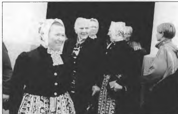
Serbowki ze Slepoho du po swjedženskich kemšach z Klětnjanskeho Božeho domu

W přichodnym čisle předstaju Wam swjedženje Židow. Woni njeznaja hody abo jutry. Swjeća hinaše swjedženje a to tež jara rady. G. Gruhlowa