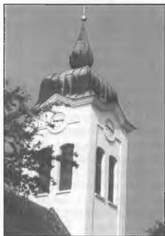
Cyrkwina wěža we Wochozach