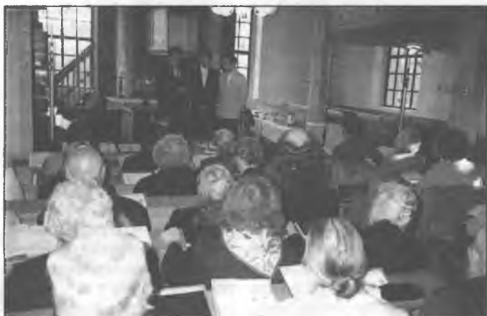
Delnjoserbske kemše w Drjejcach