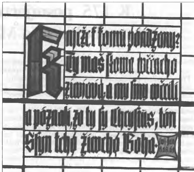
Wokno Łazowskej cyrkwy