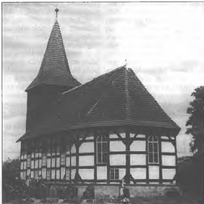
Cyrkej w Blunju.