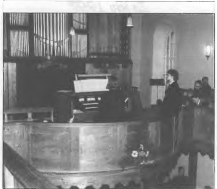
Byrgle Njeswaćidlskeje cyrkwyje