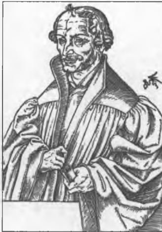
Filip Melanchthon – drjeworězba Lukasa Cranacha

Jako Serbja móžemy sej Melanchthona tež z tamnych přičinow česćić. Wón Serbow znaješe a bě hordy, zo so za jeho blidom we Wittenbergu tež serbsce rěči. Tón, kotryž swoju maćeršćinu njezapřewaše, bě Melanchthonowy přichodny syn Caspar Peucer, kotryž pochadžeše z Budyšina. 1550 bě so woženil z Melanchthonowej džowku Magdalenu, po tym zo bě so zasydlil we Wittenbergu jako uniwersitny wučer. Bórže bě Peucer Melanchthonowy posřednik za naležnosće wuchodneje Eropy. Wuznamne su jeho dopisy českokobratskemu biskopoj Blahoslavej, w kotrychž so jako Serb wuznawa. W léce 1559 poda so Melanchthonec-Peucec swójba na doľhu jězbu z Wittenberga do Budyšina. Slawného Melanchthona witachu w Budyšinje kaž wulkeho wjercha. 25. junija měješe swjedženski přednošk wo Jan Křćeniku na Budyskim gymnaziju. 9 měsacow pozdžišo so jemu přibliži wječor žiwjenja. 19. apryla 1560 zemře slawný re-