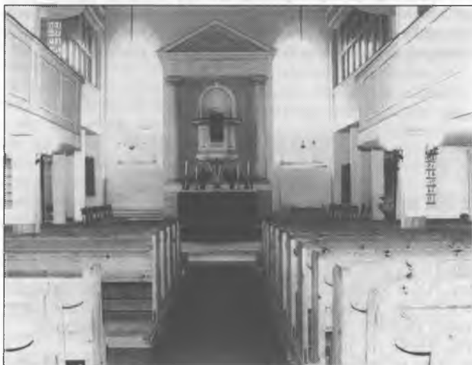
Cyrkej w Barće.