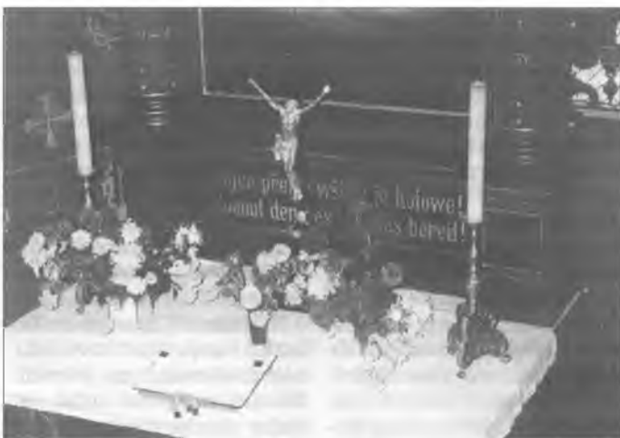
Serbske napismo na Wóslinčanskim woltarnju.