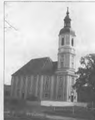
Cyrkej we Wóslinku

Zastupiš-li do Božeho domu, sy příjomnje překwapjeny. Wysokich woknow a čerstwego wumolowanja dla – w lětomaj 1985/86 so cyrkwyje dospołnje wot-