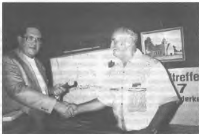
Farar Wust přepoda foto Janej šilakej.