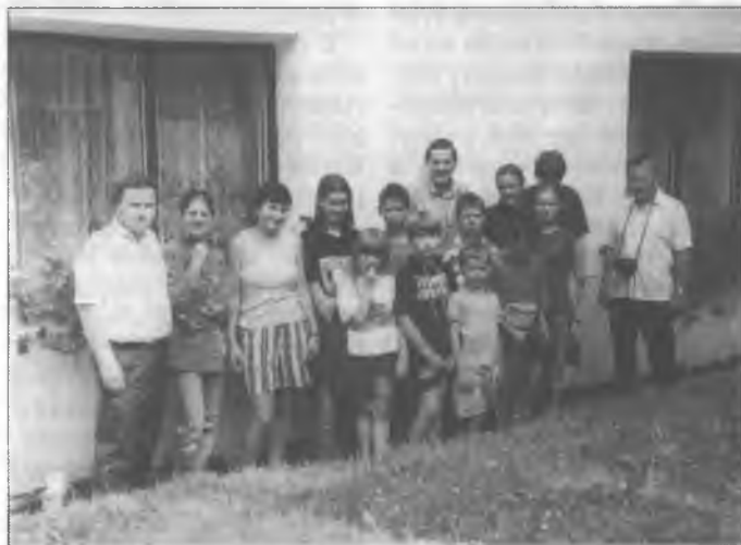
Serbska skupina z fararjom na w. Strádalom před wosadnym domom w Tisu.

Popołdnja so wužichu za pućowanja a wulěty, za kupanje a towaršliwe hry. Krasnu zaběru skićeše mała rěčka za domom. Zo bě woda dosć zymna, lědma wadžeše. Wšědnje so wnjaj kupaše, so zawěra twarje-