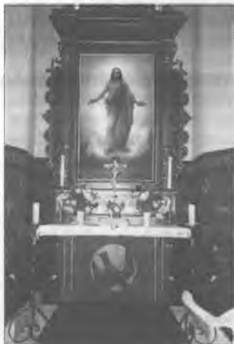
Woltarnišćo we Wóslinčanskej cyrkwi. Woltarny wobraz pochadźa z lēta 1897.

Dwuposchodowa fara z łamanej třěchu, natwarjena w lēće 1785, je nahladne twarjenje. Hakle wóndano ju wotwonka a wotnutřka