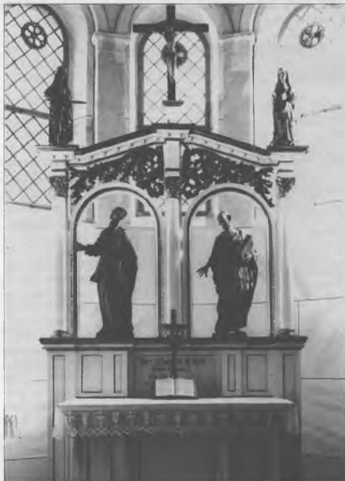
Cyrkej w Čornym Chołmcy

Njedzělu 3. adwenta swjećachu so w Hodziju na Imišowu česć dwurěčne kemše. Kemšerjow witaše cyrkwinski pozawnowy chór, a Hodzijski wosa-