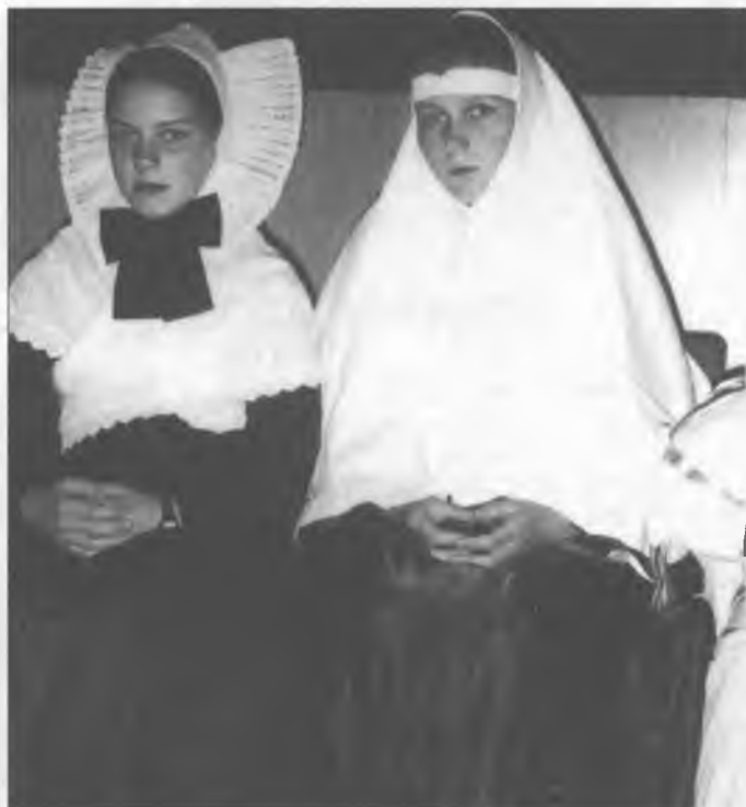
Serbskej konfirmandce, nalěwo: w ličkatej kapičce, naprawo: w płachćičce