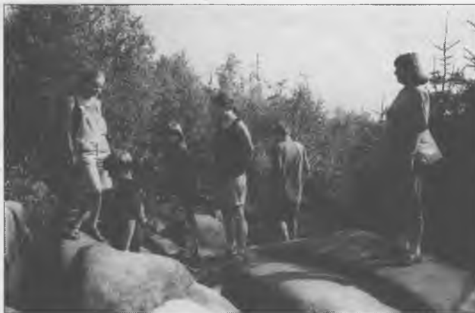
Loni na pućowanju w Tisu