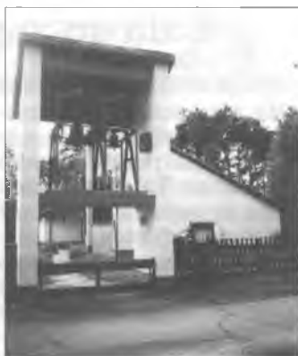
Zwonaj něhdyšeje Čelnjanskeje cyrkwyje před wosadnym domom w Hamorje

W drjewjanej cyrkwiće w Sprjowjach wuhotowa chór ewangelskeje wosady Wochozy-Hamor 15. julija wječorny lětni koncert. W swojim předowanju spominaše fararka Christa Schröder na rozbuchnjenje pod škitom pomnikow stejaceje tykowaneje cyrkwyje w Čelnjanskej cyrkwyje w Čelnjanskej cyrkwyje zwonitej džensa w 1982 natwarjenym wosadnym domje w Hamorje.