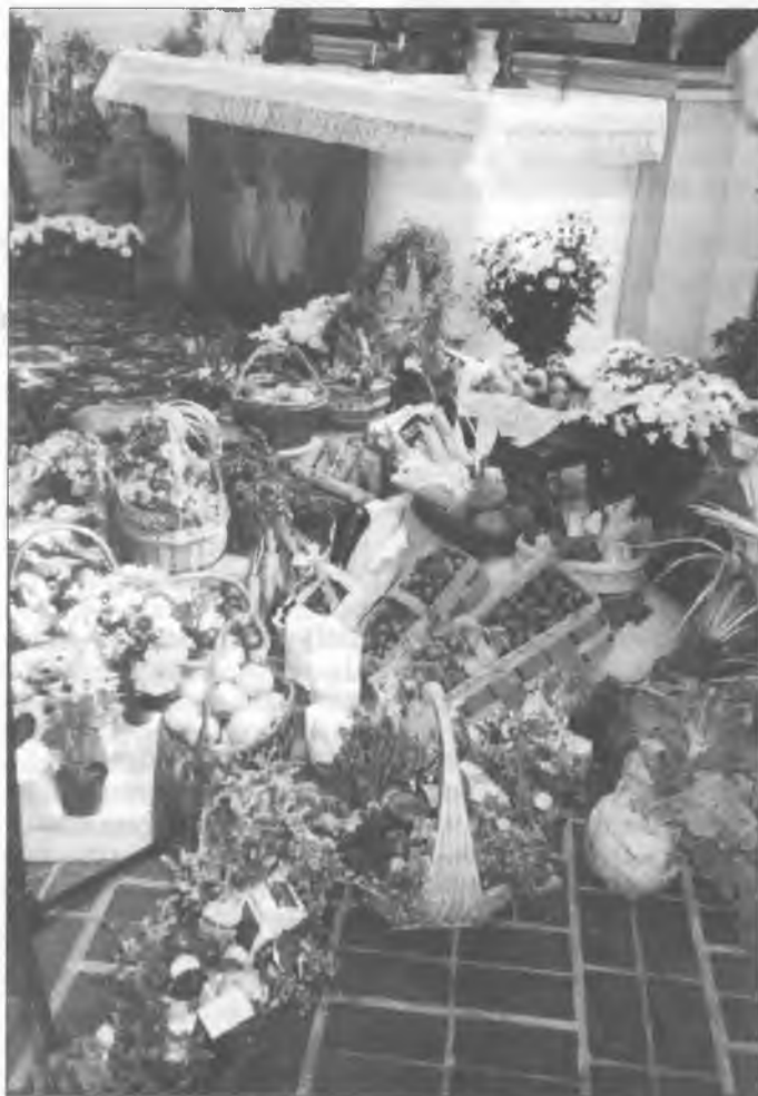
Žnjowy džakny swjedžen w Michałskej cyrkwi w Budyšinje