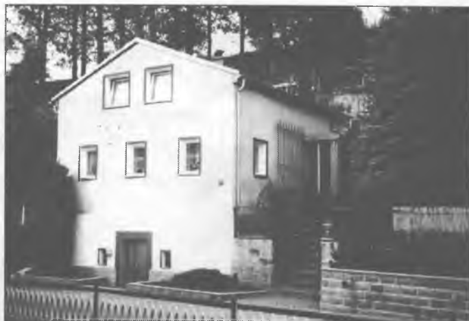
Něhdyša Frajšlagic pinca je džensa bydlenski dom.

Frajšlagowy ródny dom bě derje hladany. Bě jedyn z mało poměrnje originalnje zdžeržanych žiwnosćerskich statokow we wsy. Twarski stil a w běhu generacijow přewjedžene polěpšenja a přitwarjenja swěd-