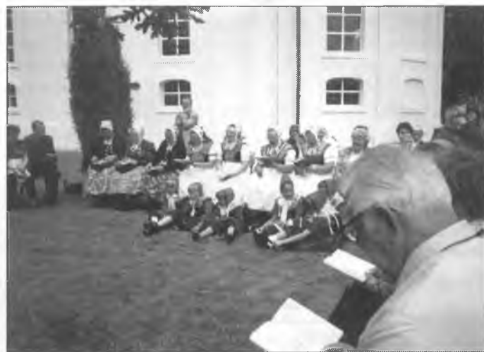
Připoldniša přestawka na cyrkwiskim dnju we Wochozach

Po kemšach nam wosadny kantor bohate stawizny cyrkwy a jeje wuhotowanje rozložić. Lětoličba nad niskim zachodom do džensnišeho