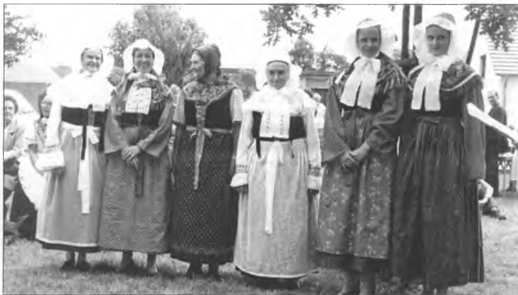
Serbowki we Wochožanskej drasće