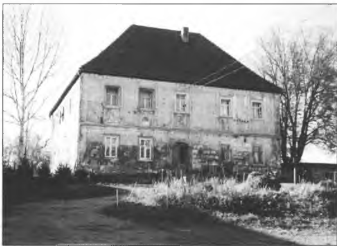
Hród Michała Budarja