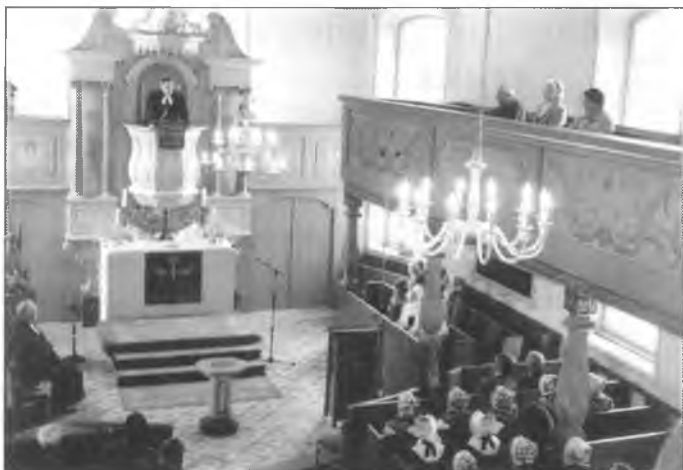
Swjedźenske kemše we Wochozach