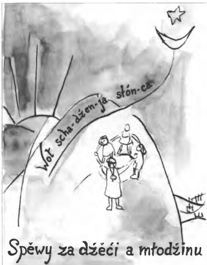
Titulna strona dźěčaceho spěwnika, rysowana wot Borbory Wiesnerec