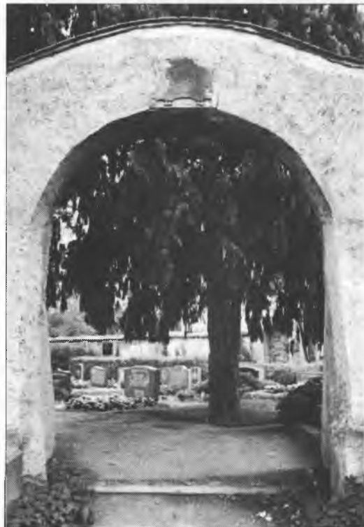
Zachod na Malešanski kěrchow ze zamurjowanej taflu

Mjeztym starša hač dwaj lěstotkaj, pěskowcowa tafla w zaštych lětach hladajcy rozpadowaše. Po mjenjenju fachowcow so wona hižo ponowić njehodžeše. Tohodla