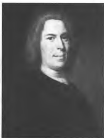
Hrabja von Zinzendorf