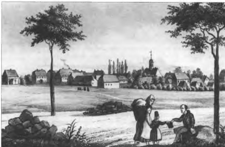
Maľy Wjelkow – Ochranowska kolonija mjez Serbami