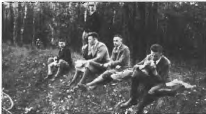
Serbske młodostne 1934 na wulěse w Dolnej Łužycy