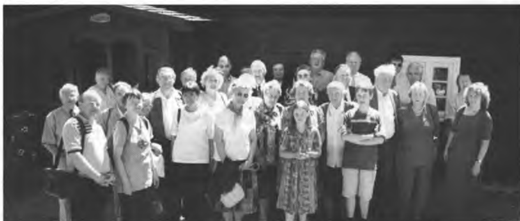
Wulětnikarjo w Rěčicach