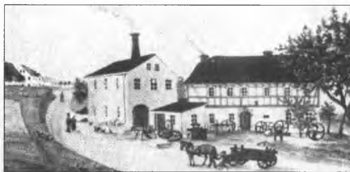
Raussendorfec historiski statok w Małych Bobolcach