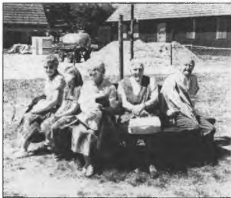
Wotpočink w Rěčicach

Při najrjeńšim wjedrje podachmy so nimo Budyskeho spjateho jězora, kiž je tu-