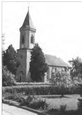
Minakal wita na 54. Serbski cyrkwinski dzeń 8. a 9. julija

Po tym zo bě farar Feustel 1995 na wuměnk šoł, je sup. Albert serbske kemše swjećil. Ale rezonanca njebě wulka. Tak je namjetował město kemšow wotměć wosadne