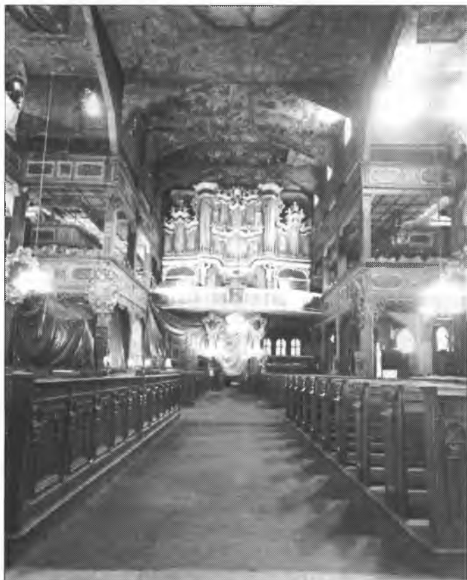
Hoberski tykowany Boži dom w Šwidnicy je bohaće wuhotowany w baroknym stilu.