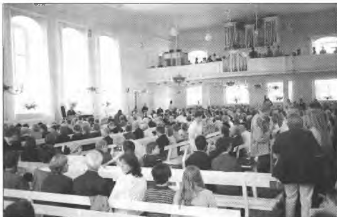
Kónčna zhromadźizna Zinzendorfoweho jubileja 28. meje 2000 w Ochranowskej modlerni