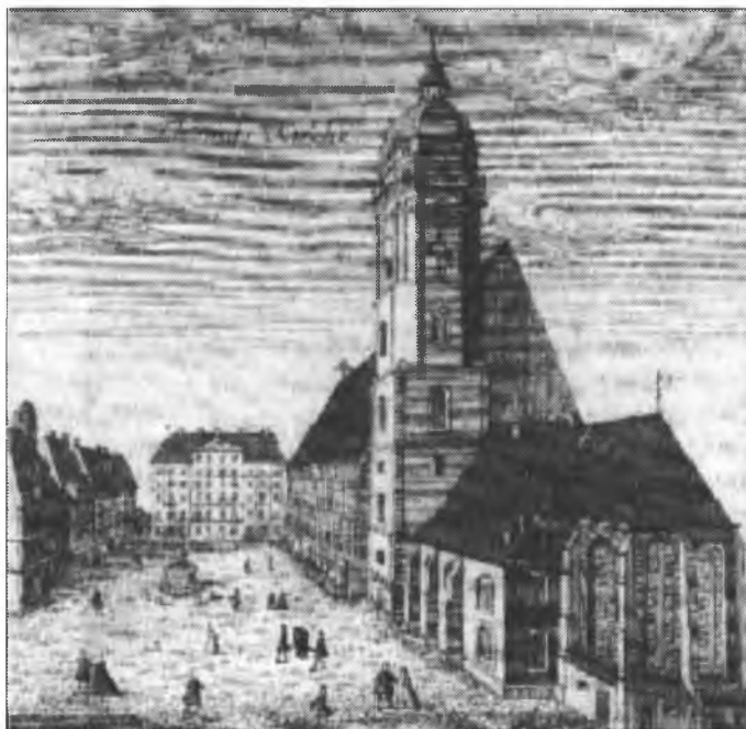
Tomašowa cyrkej w Lipsku, hdžež bě Bach z kantorom, 1749 (koprowa rytwa wot J. E. Schefflera)

hann Crüger) bě sej čas žiwjenja swójeho pochada wědomy, hačrunjež etniska přislušnosť w tehdyšej dobeskerje pódlansku rólu mjezwučencami a wumělcami hraješe. Wuznawa so pak přeco jako „Gubensis Lusatus“. Wjace hač 40 lět skutkowaše jako hudźbny direktor a kantor při Mikławšowej cyrkwi w Berlinje. Wón płači jako najwuznamniši tworjer skutkowych protestantskich kěrlušow, připóznaty sakralny komponist a hudźbny teoretikar 17. lětstotka. Jeho wučba wo komponowanju SYNOPSIS MUSICA a jeho QUAESTIONES MUSICAE PRACTICAE, příručka, kotraž so z prašenjemi praktiskeje hudźby zaběra, běštej wulkemu Bachej jako wučbnicy a fundamentalnej fachowej zarysaj wuznamne žórło studowanja a tworičelskeho zawěšćenja. Bach je sej našeho krajana tež jako kěrlušerjara wažił. Wo tym swědči jeho moteta JESU, MEINE FREUDE (BWV 227) na znaty, džensa hišće w bohosluž-