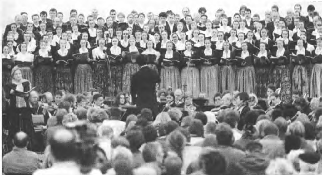
Předstajenje „Nalěća“ njedawno w kłóštrje Marijinej hwězdze.

Hišće džensa mi spěwy „Nalěća“ we wušomaj klinča. Při kopicy probow, předstajenjow a nahrawanjow je to drje tež bjez džiwa. Zhromadnje z dožiwjenjami zawostajichu we mni wulki začisć. Na „Nalěćo“ čas žiwjenja njezabudu. Jadwiga Malinkec