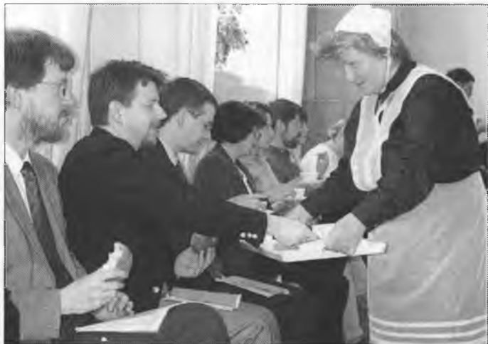
Ochranowske sotry w tradicionalnej drasće při wudželenju młokowych całtow a čaja za hosćinu lubosće