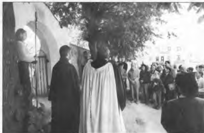
Ze swjatočnosću při pohrjebnišću so tafla zjawnosći přepoda.

Pawoł bu jedyn z najwuznamnišich předarjow a wučerjow zažneho křesćanstwa. Na swojich dalokich misioniskich jězbach dožiwi přeco zaso přesčěhowanje a husto sedži swjeho poselstwa dla w jastwje. Napisa wjele waznych listow na wšelake wosady. W nich napomina křesćanow k zhromadnosći a wukladuje jim Swjate pismo.