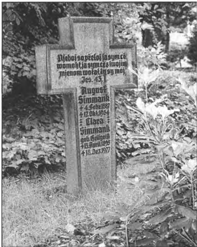
Křiž ze serbskim hronom na swojim nowym městnje na Budyskim Tuchorju.