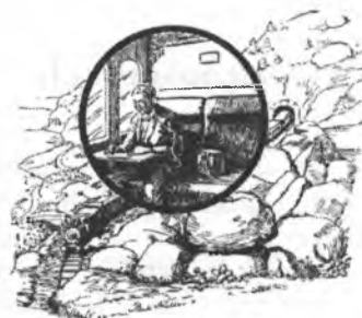
Són z lěta 1924

Njedwěluju na tym, zo budže internet za něšto lět tak powšitkowny a normalny kaž radijo a telewizija – haj, zo samo jeju wuznam přetrjechi. Nimo fincielnych a techniskich wobmjezowanjow wužiwarja wobsteji hra-