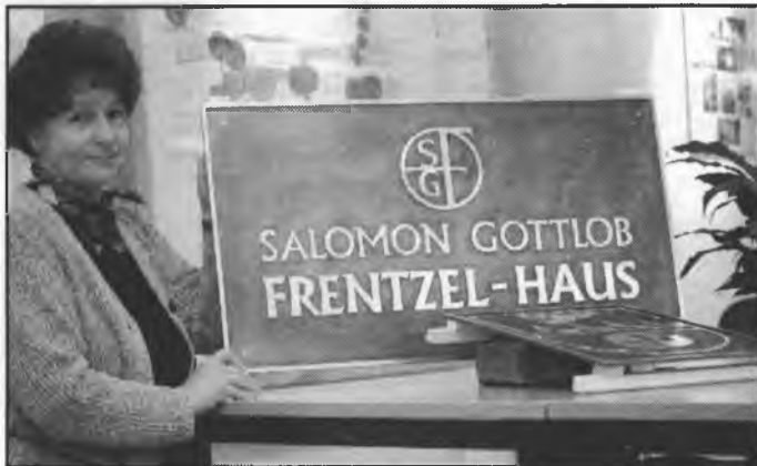
Tafla na Čornochołmčansku faru