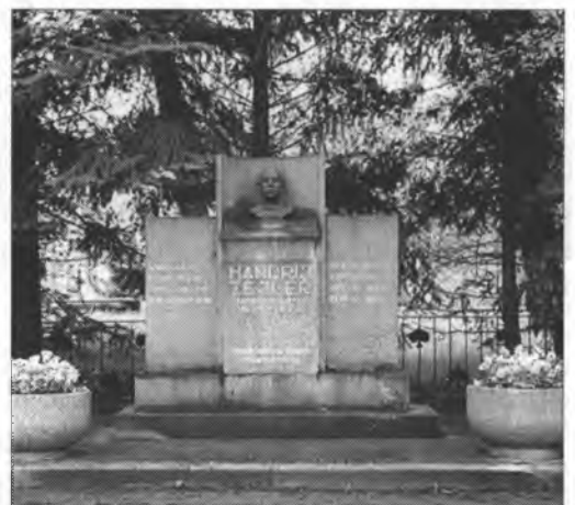
Pomnik fararja Handrija Zejlerja, postaje mjez faru a cyrkwyje