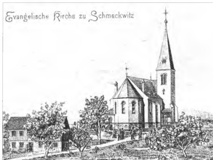
Cyrkej w Smječkecach před 100 lětami

še a nyšpory. Swjećimy zhromadnje wosadne a wjesne wjerški. To zaslyšiš tež serbsku rěč, hdyž spěwamy, próstwy přednjesemy a so modlimy. Hewak wšak w našej cyrkwi serbsku rěč njeslyšiš.