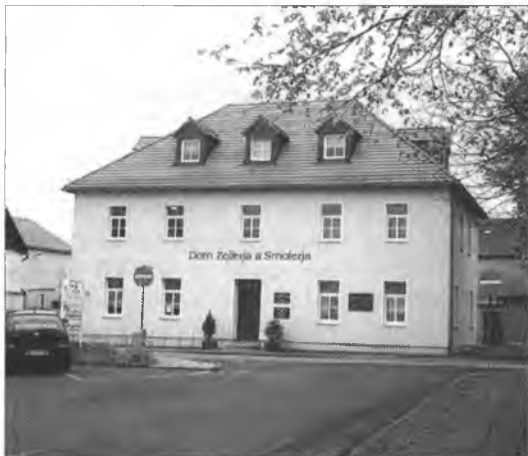
Něhdyša cyrkwinska šula je džensa Dom Zejlerja a Smolerja.

Hospodarska, socialna a narodna struktura Łazowskeje