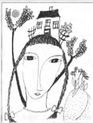
Rys. H. Wićazowa

„Hdže myslička statok swój stajš“ – pod tutym heslom stej wustajeńca z twórbami wjacorych serbskich wumělcow, kiž budže na cyrkwiskim dnju 16. a 17. junija w Łazu serbskej cyrkwi widžeć. Někotre wobrazy budu tež na předań. Tuž njezabudźće na pjenjezy!