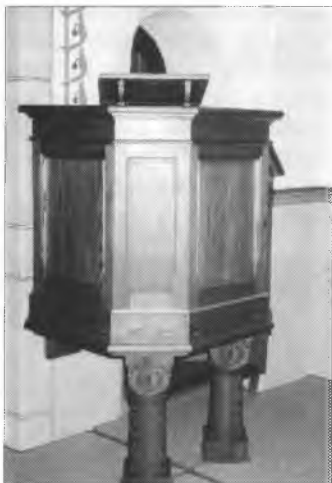
Klětka a dupa w Smječkečanskej cyrkwi