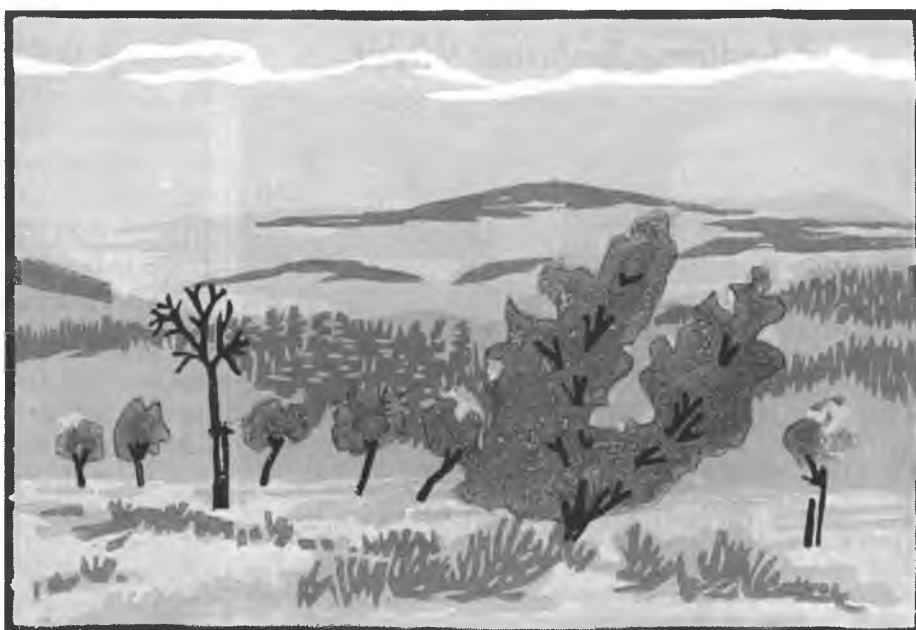
Přiroda wučí čłowjeka sćerpliwość – hórská krajina pod Běnymi Karpatami při českosłowakskej hranicy Linolowa rězba: Jiří Zejfart, 2001

Zwotkel dóstanjemy sćerpliwość? Dobry puć nam pokazuje hrono za meju z lista na Hebrejskich. „Pohladajmy na Jezusa.“