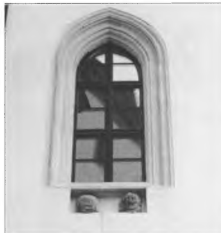
Kamjentnej hłowje holcy a mnicha pod woknom Budyskeho hroda