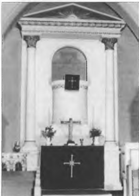
Woltarniščo w něhdyšim lučanskim Božim domje. Před 25 lětami so tule posledni króć kemše swjećachu.

Serbski ewangelski cyrkwinski džen wotměje so 8. a 9. junija w Michałskej wosadze w Budyšinje. Program wozjewimy w přichodnym čisle.