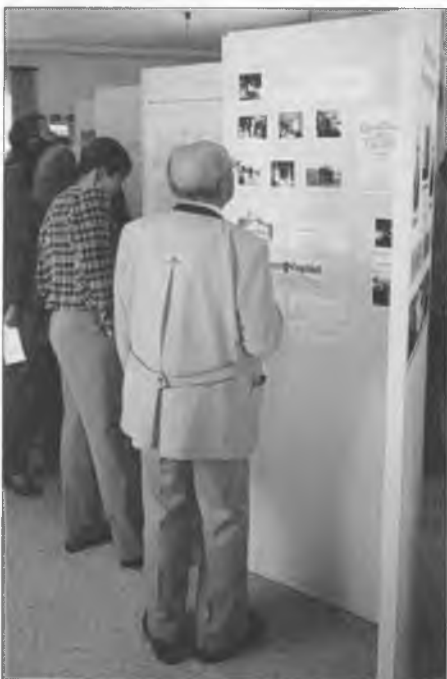
Wulki zajm zbudzi loni wustajeńca k 100lětnemu jubilejej Smječkečanskeje cyrkwyje.

Serbske słowa na swjatočnosćomaj běchu rjana gesta, wosadne žiwjenje pak bě wot započatka sem jenož němske.