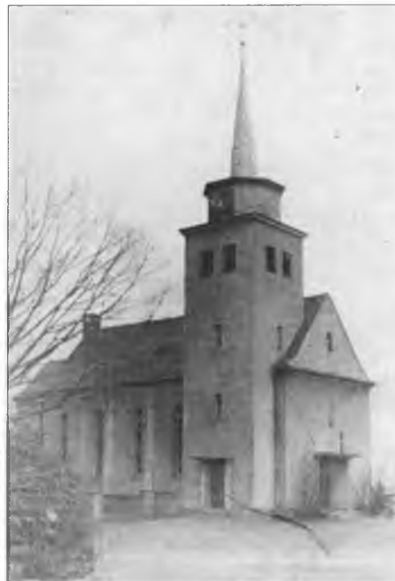
Cyrkej we Łuču – 1935 poswjećena, 1979 rozbuchnjena