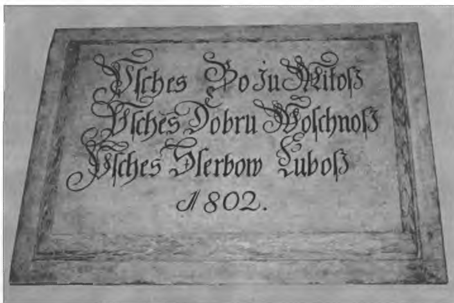
Tafla z léta 1802 při Michałskej farje w Budyšinje. Přez Serbow lubosć bu wona létsa ponowjena a na Serbskim ewangelskim cyrkwiskim dnju w juniju znowa poswjećena.

Bóh nam pomha přez swoje słowo, kotrež so nam wozjewja. Hdyž je přiwzamy, tak so naše žiwjenje přeměni a polěpši. Bože słowo je dobre za nas.