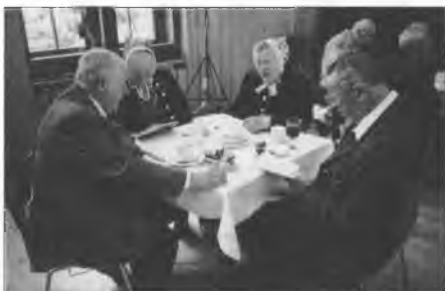
W připołdņišej přestawce zaklinčachu serbske ludowe spěwy.