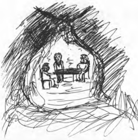
Tři starcy strážuja poklad w prózdniency pod Hrodziškom. Rys.: Jakob Gruhl

chod do prózdniency. W njej sedzachu tři starcy z dołhimi bělymi brodami. Zdachu so sami z kamjenja być. Wustróžany chcyše chudy čeknyć, tola jedyn z tych třoch mužow jemu kiwny, zo by bliže stupił. Chudy so zmuži a stupi bliže. Nadobo běše prózdnienca wo wjele wjetša a scěny blyšćachu so ze zlotom a drohoćinkami a na kamjentnym blidže kopjachu so zlotaki. Druhi brodaty rjekny jemu z hłubokim hłosom, zo smě sej tak wjele zlotakow wzać, kaž trjeba, zo njeby wjac nuzu tradał. Třeći