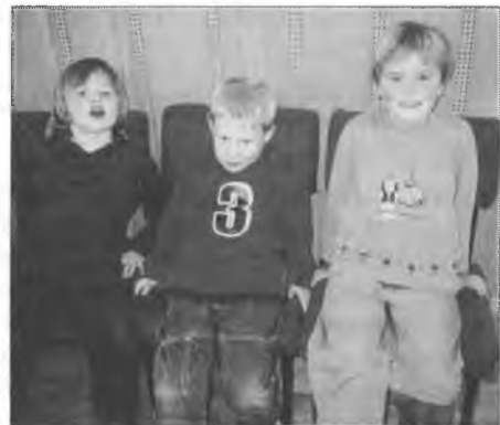
Najmłóđši wobdžělnicy cyrkwinskeho dnja