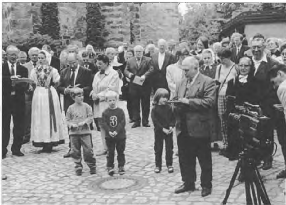
Ze zhromadnym kěrlušom zahaji so njeđzelu popođdņny před Michalskeje faru swjatočnosť wotkryća wobnowjeneje serbskeje tafla.