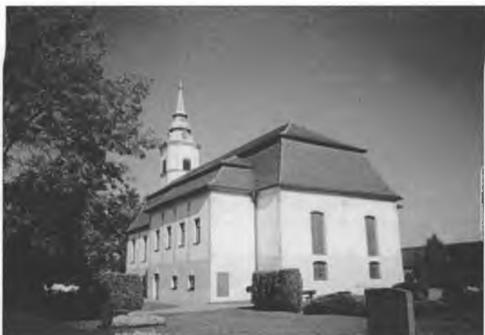
Boží dom w Delnim Wujězdze je nimale 300 lět stary.

Zdželenka redakcije: Pobrachowaceho městna dla móže so zakónčenje nastawka „Njeswarske doškrabki“ hakle w přichodnym čisle wozjewić.