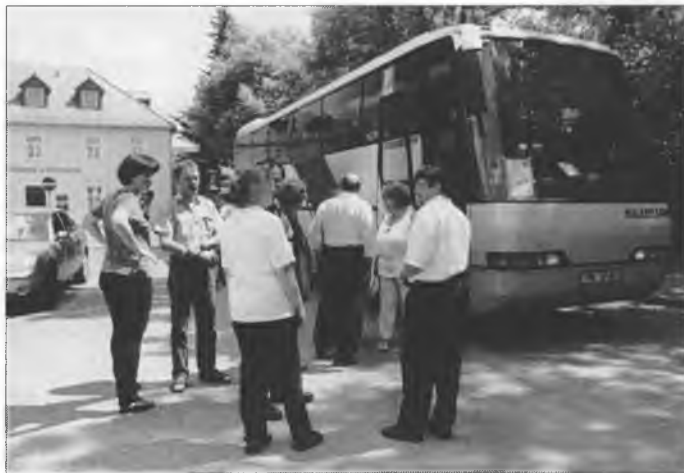
Łazowscy wosadni z českiimi hosćimi cyrkwinskeho dnja na nawsy we Łazu