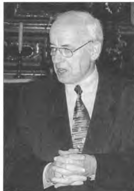
Biskop Kreß přednese sobotu postrowy sakskeje krajneje cyrkwe a rozložil předstawy wo dalšim rjadowanju serbskeho džěta.

Farar Malink swjećeše kemše z Božim wotkazanjom. Man-