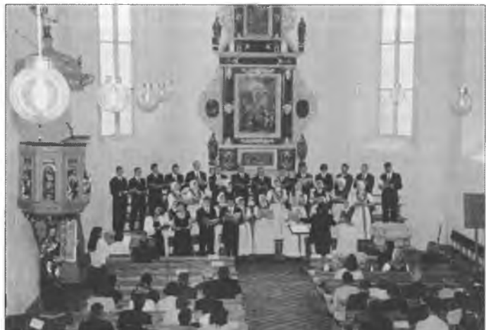
W nimale poťnje wobsadženej Michalskeje cyrkwi poskići chór „Budyšin“ njeđzelu popođdņny wuběrný koncert.