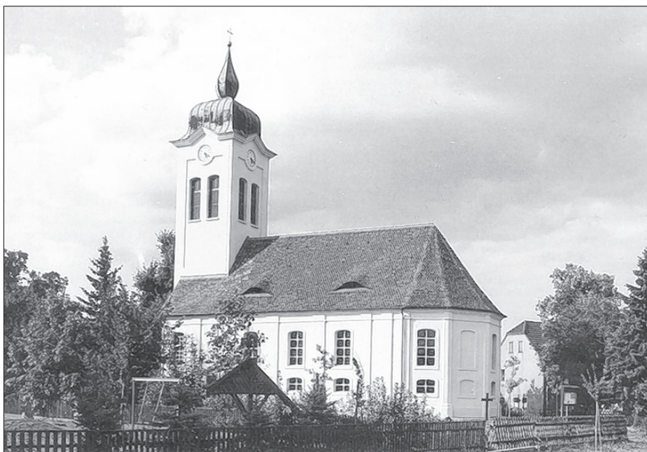
Boží dom we Wochozach, natwarjeny srjedz 18. lěstotka