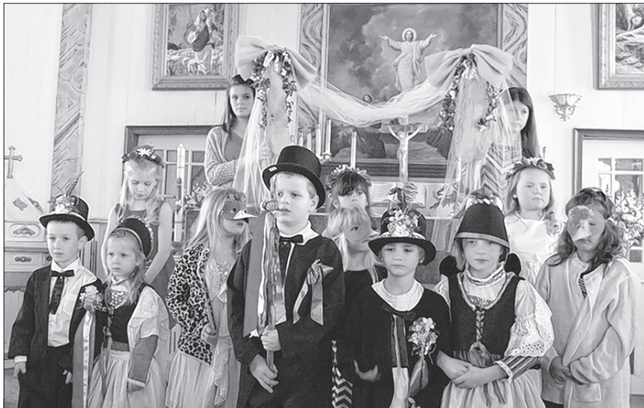
a ze swatom (naprawo) před wołtarjom Serbinskeje cyrkwy loni 25. januara

Drastu za brašku, nawoženju a njewjestu kaž tež družku a swata je serbske to-