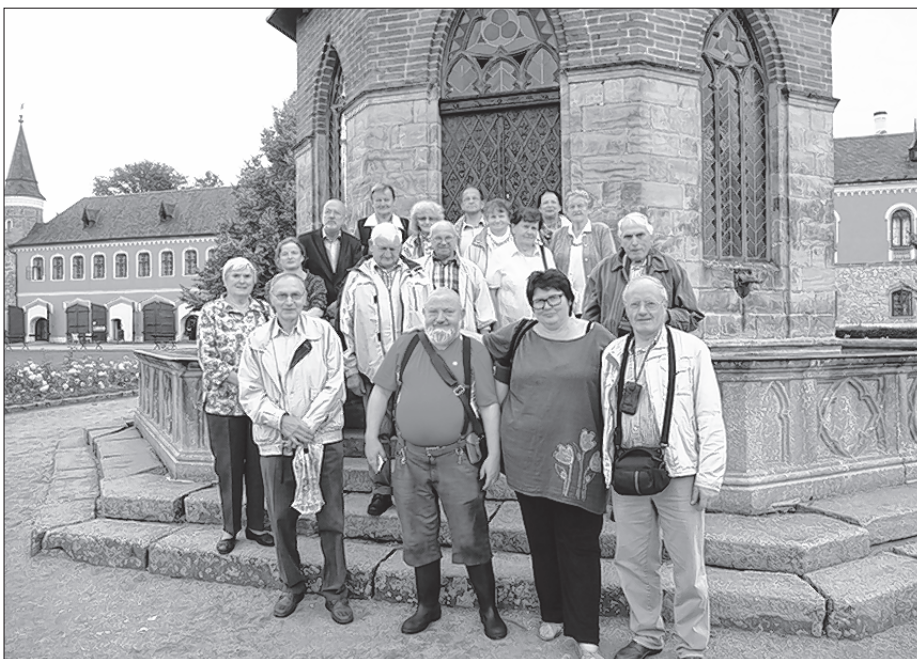
Serbscy wulětnikarjo w Sychrowje