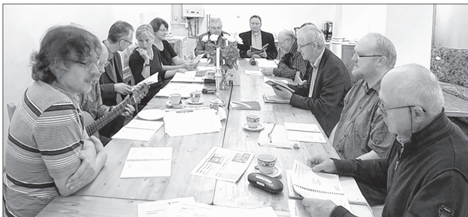
Posedźenje Serbskeje přirady EKBO w Lubanju