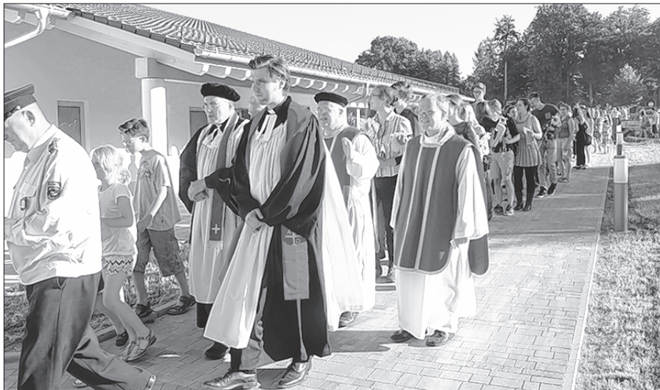
Swjedženski začah k poswjećenju noweho gymnazialneho twarjenja ewangelskeho šulskeho towarstwa 24. awgusta 2016 w Husce

strowotnych přičin dla 28. februara 2017 na wuměnk. Tole zbudži prašenje, kak so džěťo po jeho wotchadze dale wjedze. Ze strony šulskeho towarstwa widzi so puć w tym, zo so zarjadnistwo dale zesylni a zo so za duchowne zastaranje w šulach dalši sobudželaćer zbuduje. Dla zastupnistwa za čas wakancy w Husce je so Budyski superintendent Waltsgott fararja Malinka naprašował. jm