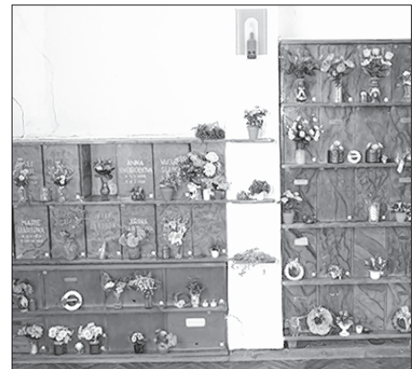
Kolumbarium w Turnowskeje cyrkwi