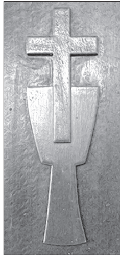
Symbol husitskeje cyrkwyje: kříž w keluchu