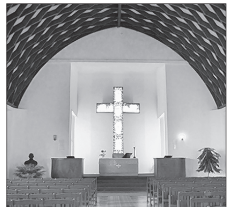
Wobsweřtleny kříž we wołtarnišću cyrkwyje