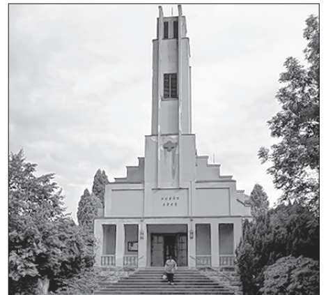
Husův sbor – Husitska cyrkwej w Turnowje