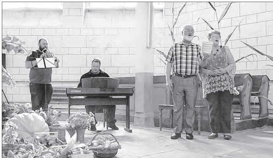
Hufec mandželskaj a jeju synaj z Awstralskeje hudžachu a spěwachu na žnjowodžaknych kemšach w Bukečanskej cyrkwi.