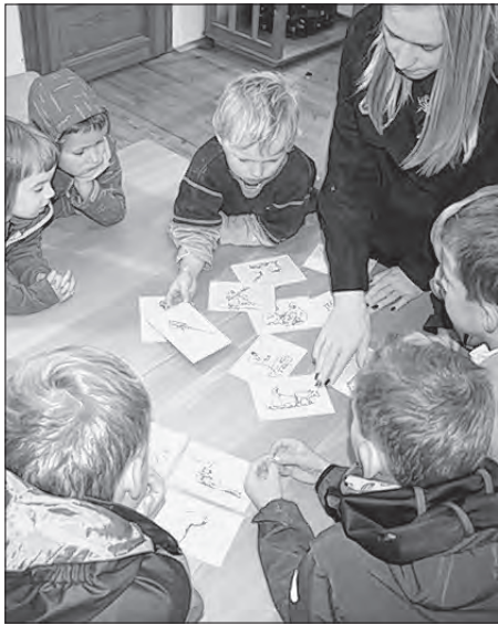
Rady sej džěci hromadze hrajachu.

Tema ewangelskeho kónca tydženja bě tutón raz „Syjemy a žnějemy“. Wosebje Jezusowe přirunanje wo syjerju steješe tu w srjedzišću rozpomínanja. Mjeztym zo so