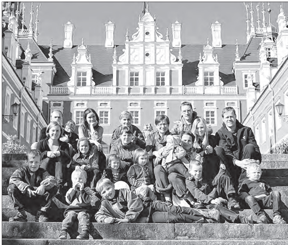
Wobdžělnicy serbskeho nabožneho kónca tydženja před Mužakowskim hrodom