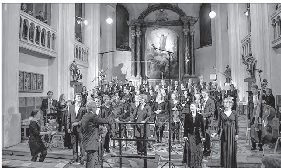
Předstajenje „Serbskeho rekwiema“ w Chróšćanskej cyrkwi