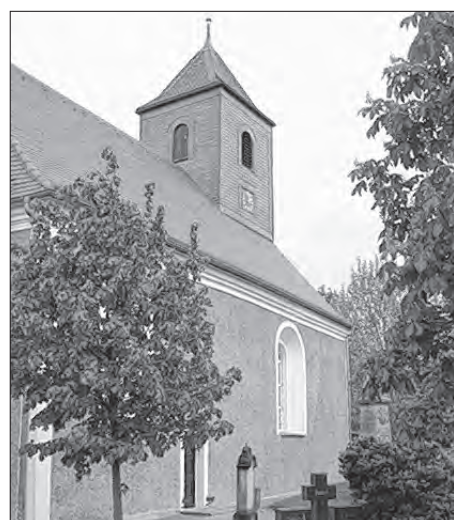
Cyrkej w Hućinje

W lěće 2013 běše Serbski ewangelski cyrkwinski džen w Delnim Wujězdze. Tehdy móžachu wopytowarjo wobdźiwać krasnu baroknu pychu tamnišeho Božeho doma. Lětsa woswjeći wosada 300lětny jubilej swojeje cyrkwyje ze swjedzenskim kóncem tydženja wot 4. do 6. nowembra. Pjatk předstaji Budyske dźiwadło hru wo Gregoriusu Mättigu „Gregor přińdže domoj“. Sobotu wotměje so wosadny swjedžeń na žurli hosćenca „Tři lipy“ z Łazowskim cyrkwiskim chórom a muskim chórom z Del-