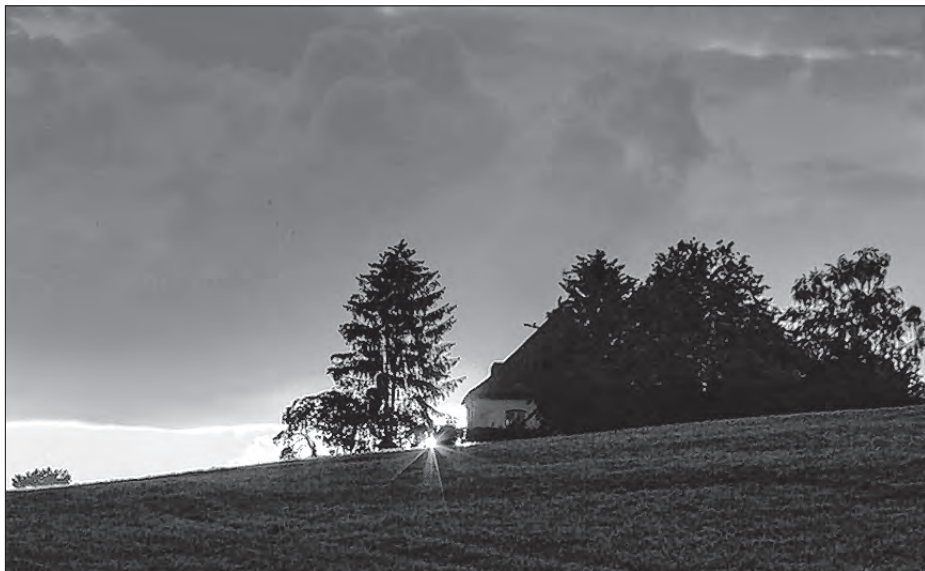
Poslednja pruha swětló