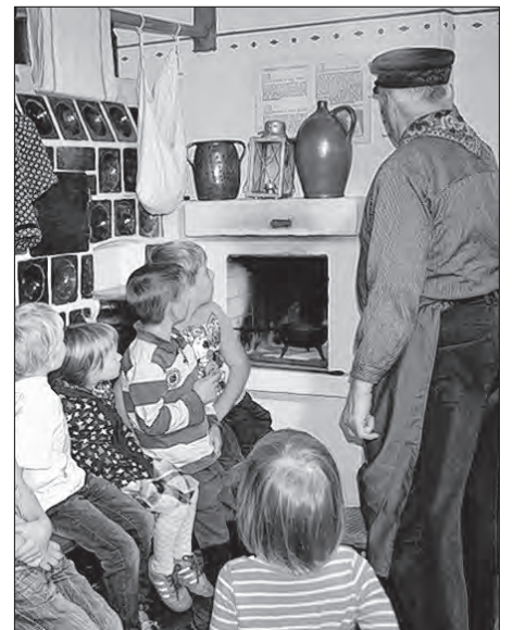
Na Rownjanskim Njepilic statoku zhonichu wobdžělnicy, kak holenjo něhdy doma tkajachu (horjeka) a warjachu.