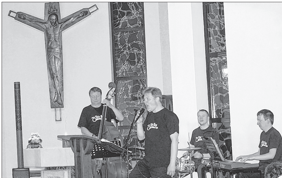
Skupina Kula Bula je w Choćebuzu předstajila serbske a mjzynarodne spěwy.