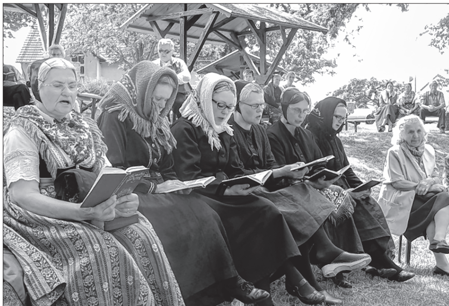
Na swjedźenišću w Nowym Měście zanjesechu wobdžělnicy njedzeli popołdnu serbske kérluše a ludowe spěwy.