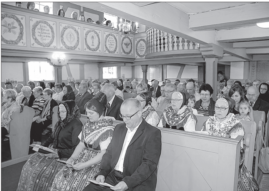
Kemšerjo na lětušim domizniskim dnju w Sprječanskim Božim domje