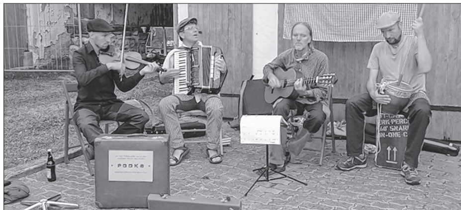
Skupina Podka z Drježdžan lětsa znowa we Wuježku zahudzi.

W bróžni budže bifej přihotowany. Štóż chce tykanc napjec abo něšto za bifej př-