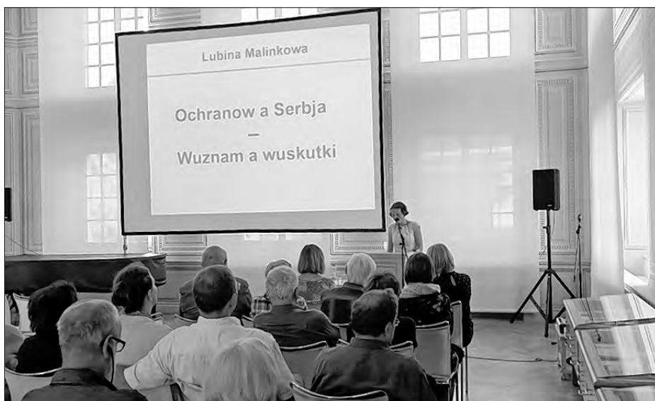
Přednošk w Serbskim muzeju