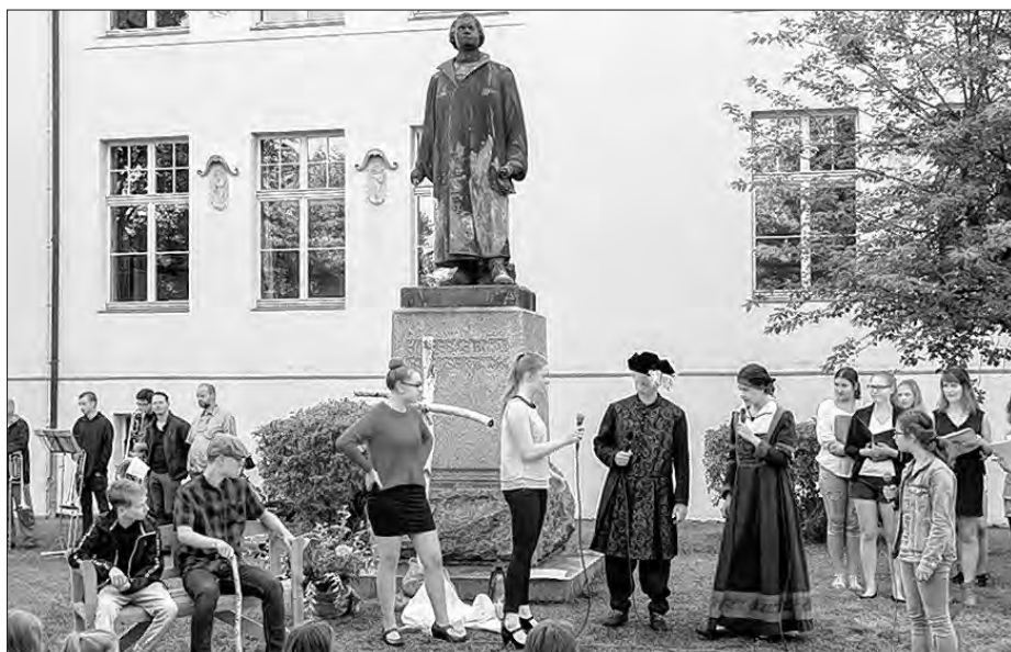
Swobodna džiwadłowa skupina Delnjoserbskeho gymnazija zahra scenu wo nawróće reformatora Martina Luthera a jeho mandželskeje do džzensnišeho časa, kiž běchu šulerjo samostatnje napisali a nastudowali.