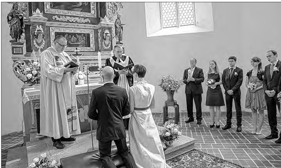
Ekumeniske wěrowanje lěta 2013 w Budyskej Michalskej cyrkwi