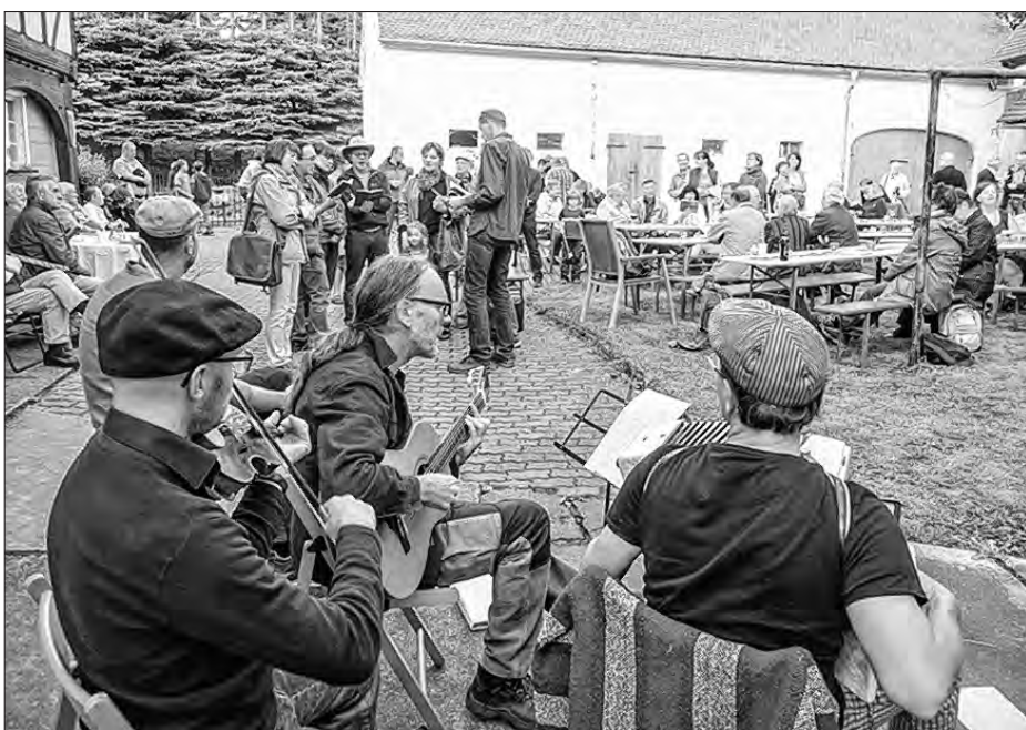
Z hudźbnym přewodom skupiny Podka z Drježdźan so wopytowarjam dworowego swjedženja rjenje serbsce spěwase.

Po přestawce na wjeršku so wšitkim zaso lóštne horu dele stupaše. Připódlu nazběrachu so někotre kurjatka a dalše hriby. Na dworje Pawlikec statoka móžachu so potom wšitcy z kofejom a tykancom posylnić. Tu bě so mjeztym tež tójšto dalšich wopytowarjow zhromadziło – předewšěm starši Serbja z Bukečanskeje a druhich wosadow Budyskeho kraja, ale tež skupina