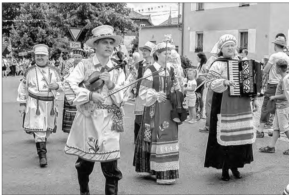
Běloruska skupina Krupickije muzyki ducy na swjedźeniščo pod Fulkec hórku

Džěchmoj dale, wězo na kěrchow. Tón pak je derje hładany! Ju však, Serbja wědža, što so słuša a njejsu někajki njekultiwěrowany lud. Pytach za Jurja Brězanowym rowom. Někotre z jeho spisow ze stalinistiskeje doby hišće w mojim knižnym kamorje steja. Njech tam drěmaja! Jurij Brězan bě so mje bórže po přewróce na ⇨