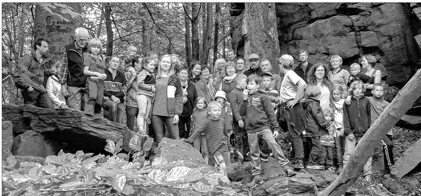
Wulcy a mali pučowarjo před skaliznami na wjeršku hory Rubježny hród