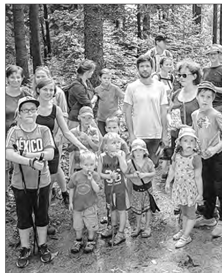
Na kóždolětnych swójbných pućowanjach a dworowych swjedženjach we Wuježku pod Čornobohom wobdžěleja so ewangelscy a katolscy Serbja. Foto je z lěta 2016.