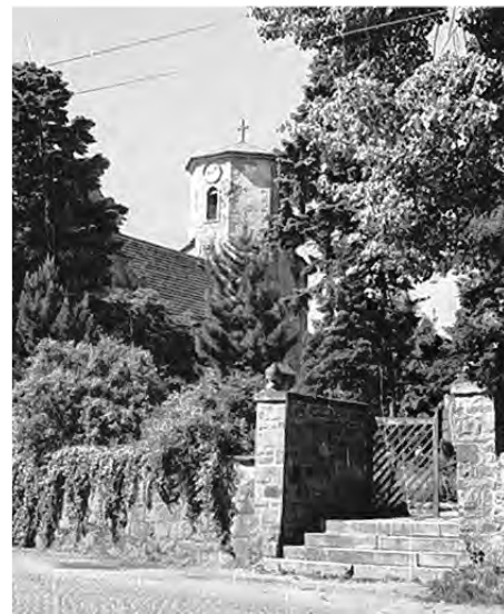
Njeswačidlska cyrkej w 1960tych lětach. Tu wotmě so 23. julija 1967 přenja serbska ekumeniska nutrnosc.

Přenja serbska ekumeniska nutrnosc wotmě so 23. julija 1967 w Njeswačidle.