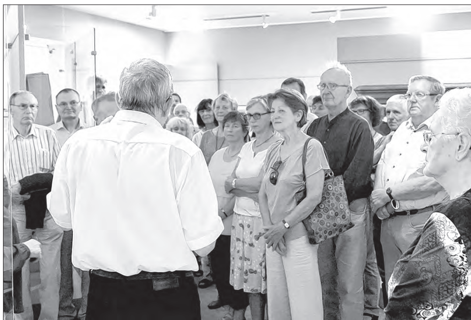
Mnoho zajimcow wobdžěli so na wjedženju k zakončenju reformaciskeje wustajeńcy 27. žnjenca w Budyskim Serbskim muzeju.