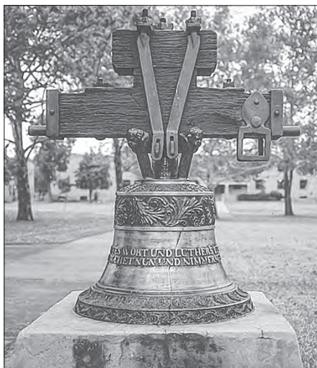
Wot Friedricha Gruhla w Małym Wjelkowie 1854 laty zwón steješe wot 1958 do 2008 w zelenišću na kampusu Concordia Lutheran College w Austinje. Foto: T. Malinkowa 1992