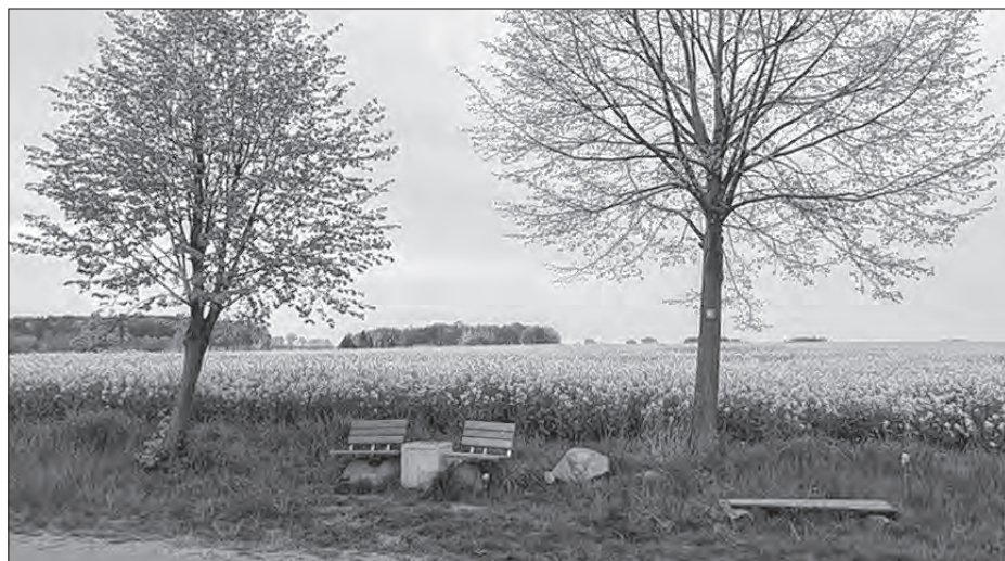
Pomjatne městno na wyšinje mjez Małej Boršču a Praskowom, hdžež bě serbski ludowy kěrlušer Pětr Mlónk z Džiwoćic 6. februara 1887 zemřě.