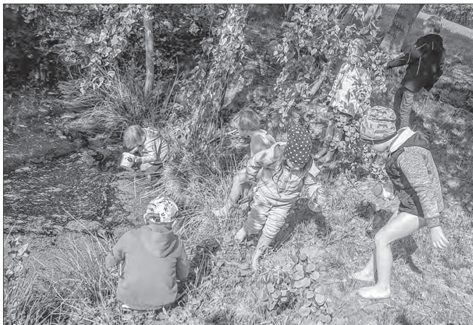
K temje woda džěći z radosću eksperimentuja a w rěčkach haćenja twarja.