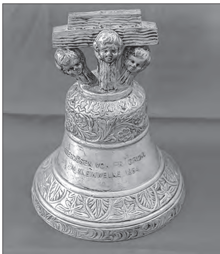
Cynowy model Małowjelskowskeho zwona z lěta 1854, laty 2000 w Indiskej, přepoda awtor přinoška Ioni Budyskemu Serbskemu muzej.