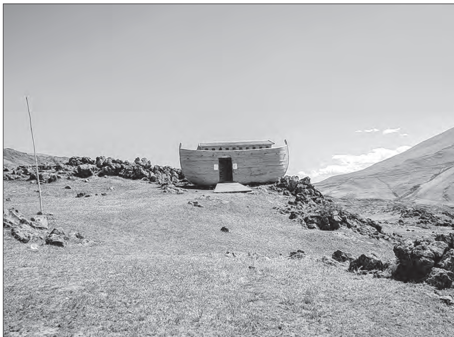
Noachowa archa přistawi po bibliji na horje Ararat. Organizacija Greenpeace natwari tam w lěće 2007 kopiju archi, zo by na škódnosć klimoweje změny skedźbniła.