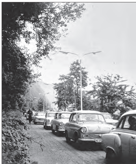
21. awgusta 1968 při hraničnym přechodze w Hřensku, hdžež poda so dołha kolona NDRskich awtow přes mjazu.