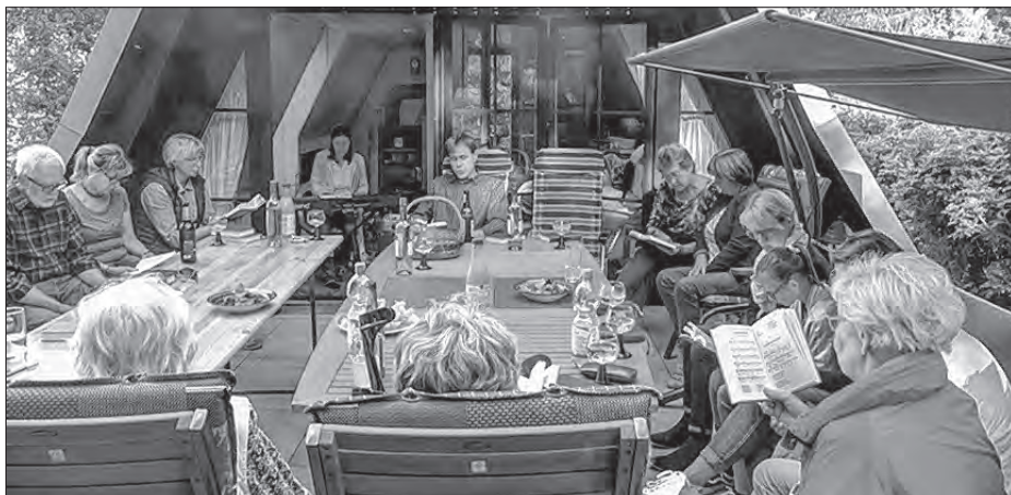
Spěwanski wječork Bukečanskeje Bjesady w Žornosykach

baskami. Cuškec swójbjje so za poradžene zetkanje wutrobne džakujemy. M. Wirth