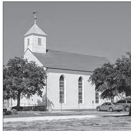
Cyrkej w Serbinje, na kotrejž je zwón něhdy zwonil

Puknjeny zwón chowachu dalše 23 lět we wěži Serbinskeje cyrkwyje. W lěće 1926